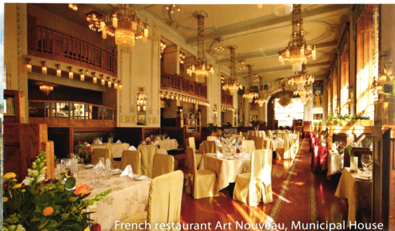
French restaurant Art Nouveau, Municipal House