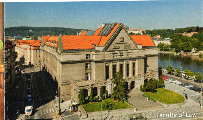
Faculty of Law