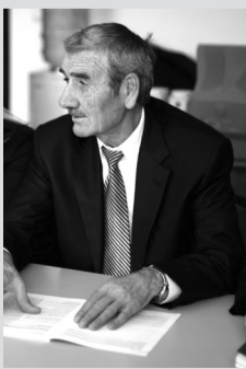
პროფესორ-კემბრიჯის რეპაზ ზოსიძე

გილოცავთ ახალ წელს უნივერსიტეტის თითოეულ თანამშრომელს, პროფესორ მასწავლებლებს, სტუდენტებს და მეგობრებს! გისურვებთ წარმატებებს სწავლაში და შრომაში, ჯანმრთელობასა და ბედნიერებას პირად ცხოვრებაში. მადლიერებას გამოვხატავ მშობლიური უნივერსიტეტის მიმართ, რომელთანაც მაკავშირებს მთელი ჩემი მოღვაწეობა და საუკეთესო მოგონებები. მეამაყება და მბედნიერებს ის, რომ ვარ უნივერსიტეტელი. მისასალმებელია, რომ უნივერსიტეტი ახალ წელს ხვდება კეთილმოწყობილი სასწავლო-სამეცნიერო კაბინეტ-ლაბორატორიებით, ნათელი აუდიტორიებით, სადაც სწავლა და შრომა მეტად სასიამოვნო და სახალისოა. კიდევ უფრო გაბრწყინებული და წარმატებული ყოფილიყოს ჩვენი უნივერსიტეტი და სრულიად საქართველო.