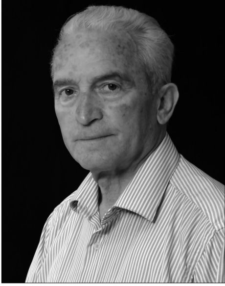
— ბატონო ბიჭიკო, გთხოვთ მოკლედ გვიამბოთ თქვენს შესახებ...