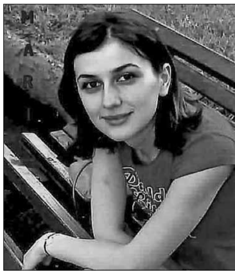
ბი იცვლებიან, დრო არ ჩერდება, გაივლის წლები და ჩვენც გავხდებით დედები, მამები, ბებიები და ბაბუები.

მერე მოვლენ სხვები, ჩვენც მოვიგონებენ, სოფელში კვლავ გავარდება თოფი და ბიჭის დაბადებას იხვიმებენ, მერე ვილაცა ისევ დანერს ჩვენზე, როგორც მე ვნერ ახლა.