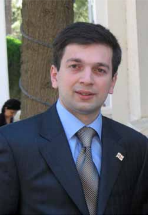
მოგესალმებით ევროპის შუაგულ – უნგრეთის დედაქალაქ ბუდაპეშტიდან! მინდა თქვენი მეშვეობით მივულოცო შოთა რუსთაველის სახელმწიფო უნივერსიტეტის სამართალმცოდნეობის სპეციალობის სტუდენტებს, კურსდამთავრებულებს,

პროფესორ-მასწავლებლებსა და ადმინისტრაციას იურიდიული ფაკულტეტის 20 წლის იუბილეს დარწმუნებით ვარ, ამ პერიოდის მანძილზე მიღწეული წარმატებები, სიამაყის გარდა, კიდევ უფრო სრულყოფისა და დასახული მიზნების რეალიზების სანდარტისა.