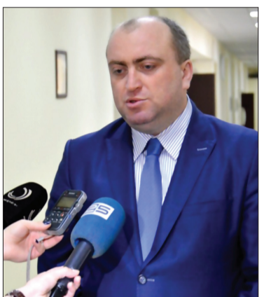
დენტებსა და პროფესორ-მასწავლებლებს.

მოინახულეს სტუდენტებისათვის მოწყობილი თავისუფალი სამუშაო სივრცეები, საინფორმაციო ტექნოლოგიების კაბინეტი, განახლებული ზოოლოგიისა და მინეროლოგიის კაბინეტები, იურიდიული კლინიკა, განახლებული სამართლო საინფორმაციო დარბაზი, თანამედროვე კრიმინალისტიკური ლაბორატორია, ფოტო-ვიდეო სტუდია და ა.შ. გაესაუბრა სტუ-