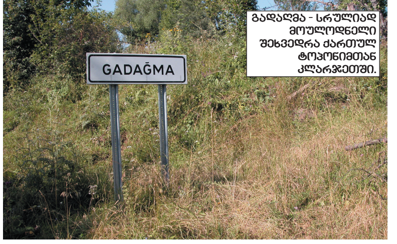
გადაღმა - სრულიად მოულოდნელი შიხვიდრა ქართულ ტოპონიმთან კლარჯეთში.