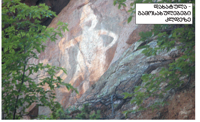
დახატულა - გამოსახულებები კლდეზე