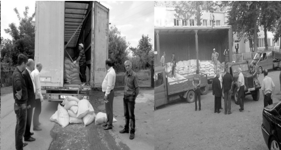
დეფეკატის დარიგების პროცესი აჭარის მეციტრუსეობის სოფლებში

მაქსიმალურად ახორციელებდა ფერმერთა ინფორმირებულობის ხელშეწყობას ყოველი მოახლოებული წამლობითი ღონისძიებების დროული და ეფექტურად განხორციელების აუცილებლობის თაობაზე. ასევე, წელს პირველად სახელმწიფო პროგრამით ამოქმედდა აგრო დაზღვევის პროგრამა, რომელშიც 10 000 — მდე მეციტრუსე ჩაერთო. პროგრამა ითვალისწინებს მოსავლის დაზღვევას, სახელმწიფოს ფინანსური თანამო-