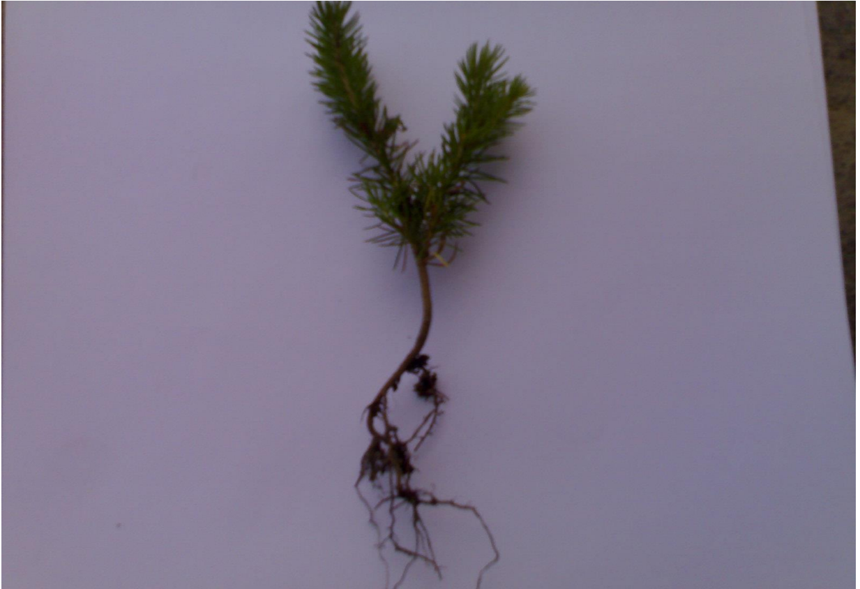
სურ.20. აღმოსავლეთის ნაპეის 3 წლიანი აღმონაცენი (გოდერძის უღელტეხილი, სულო, 2012 წ.)