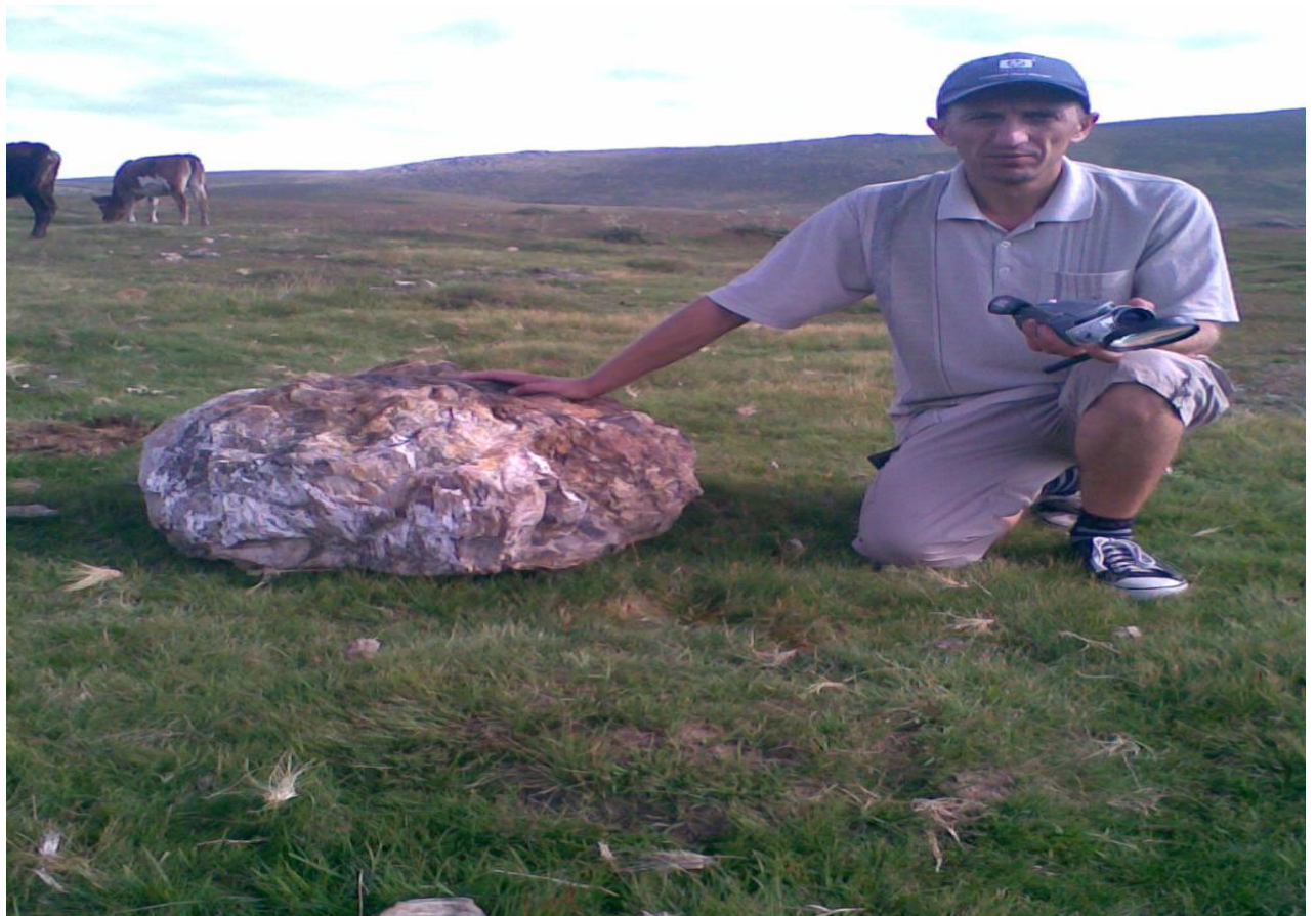
20. გოდერპის უღელტეხილის ნამარხი ფლორა ("სათიბი", გოდერპის უღელტეხილი, 2009 წ)