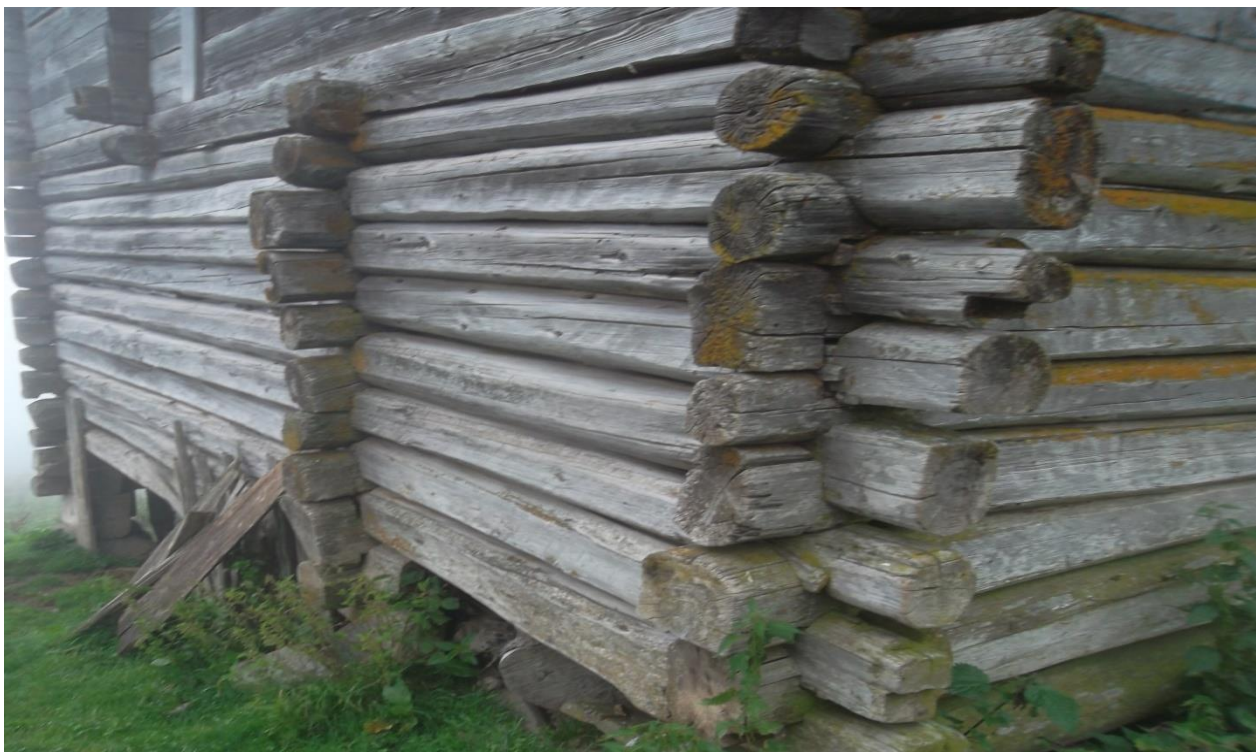
სურ.1. მრგვალი ხე-ტყისაგან აშენებული საცხოვრებელი სახლი (გოდერძის უღელტეხილი – “ყორანა” ხულო, 2009 წ)