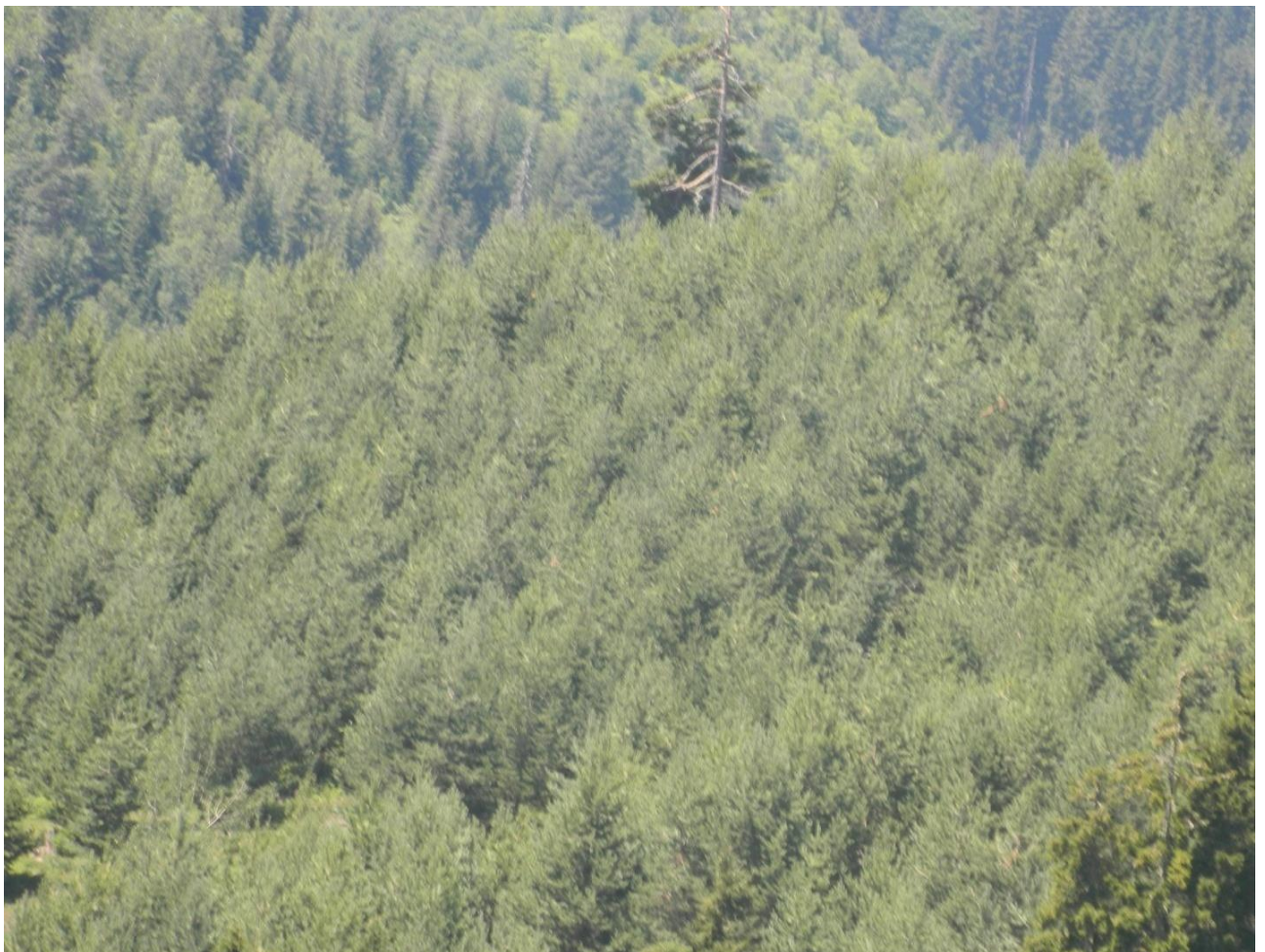
5. ხელოვნურად გაშენებული ჩვეულებრივი ფიჭვის კულტურები, (“კუშტური”, შაგნაბადა, ხულო 2012 წ.)