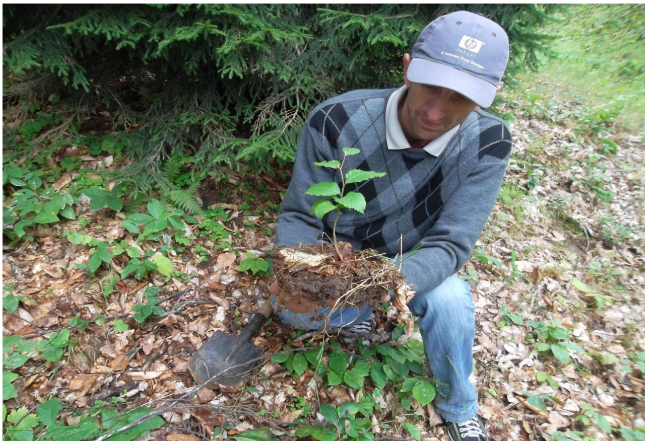
13. აღმოსავლეთის წიფლის 3 წლიანი აღმონაცენი (გოდერძის უღელტეხილი, 2011 წ.)