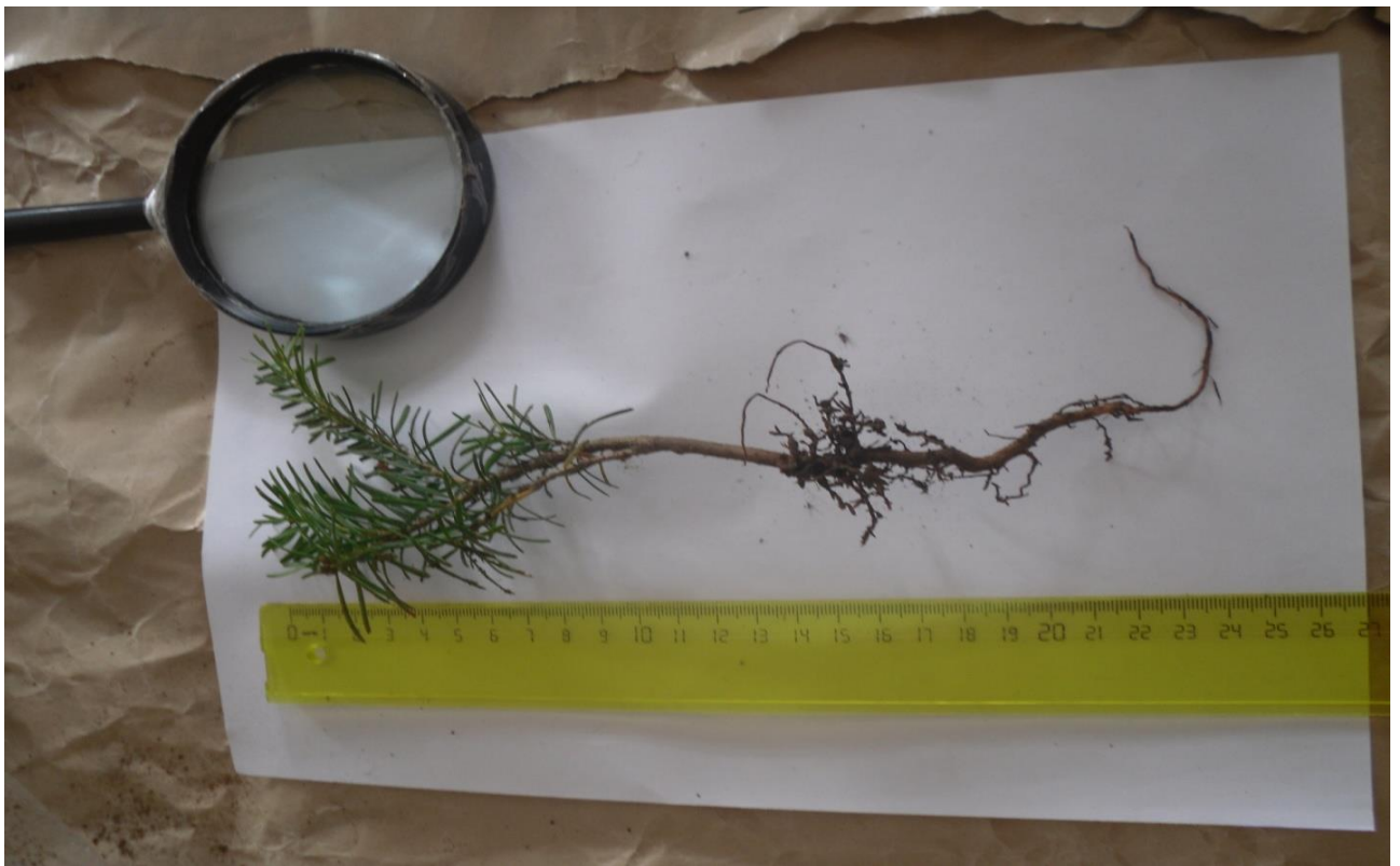
17. კავკასიური სოჭის სივრძის და ხნოვანების დადგენა (“ზანკები”, ხულო, 2009 წ.)