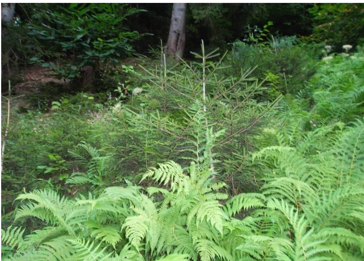
სურ. 4. გვიმრიანი ნაძვნარ-სოჭნარი ტყის ტიპში აღმოსავლეთის ნაძვის მოზარდი, (“მერცხლები” – ხულო)

თემატიკიდან გამომდინარე ჩვენს მიერ ყურადღება გამახვილებული იყო გვიმრიანი ნაძვნარ-სოჭნარი ტყის ტიპის ბუნებრივი განახლებაზე, რომელიც მდებარეობს ზღვის დონიდან გარკვეულ სიმაღლეზე არსებულ სხვადასხვა დახრილობის ფერდობებზე, სადაც შევისწავლეთ აღმონაცენ-მოზარდის რაოდენობა სიმაღლეთა სხვადასხვა ჯგუფების მიხედვით. მიღებული მონაცემები მოცემული გეაქვს ცხრილ 3.4.-ში, საიდანაც ნათლად ჩანს, რომ აღნიშნულ ტყის ტიპში ბუ-