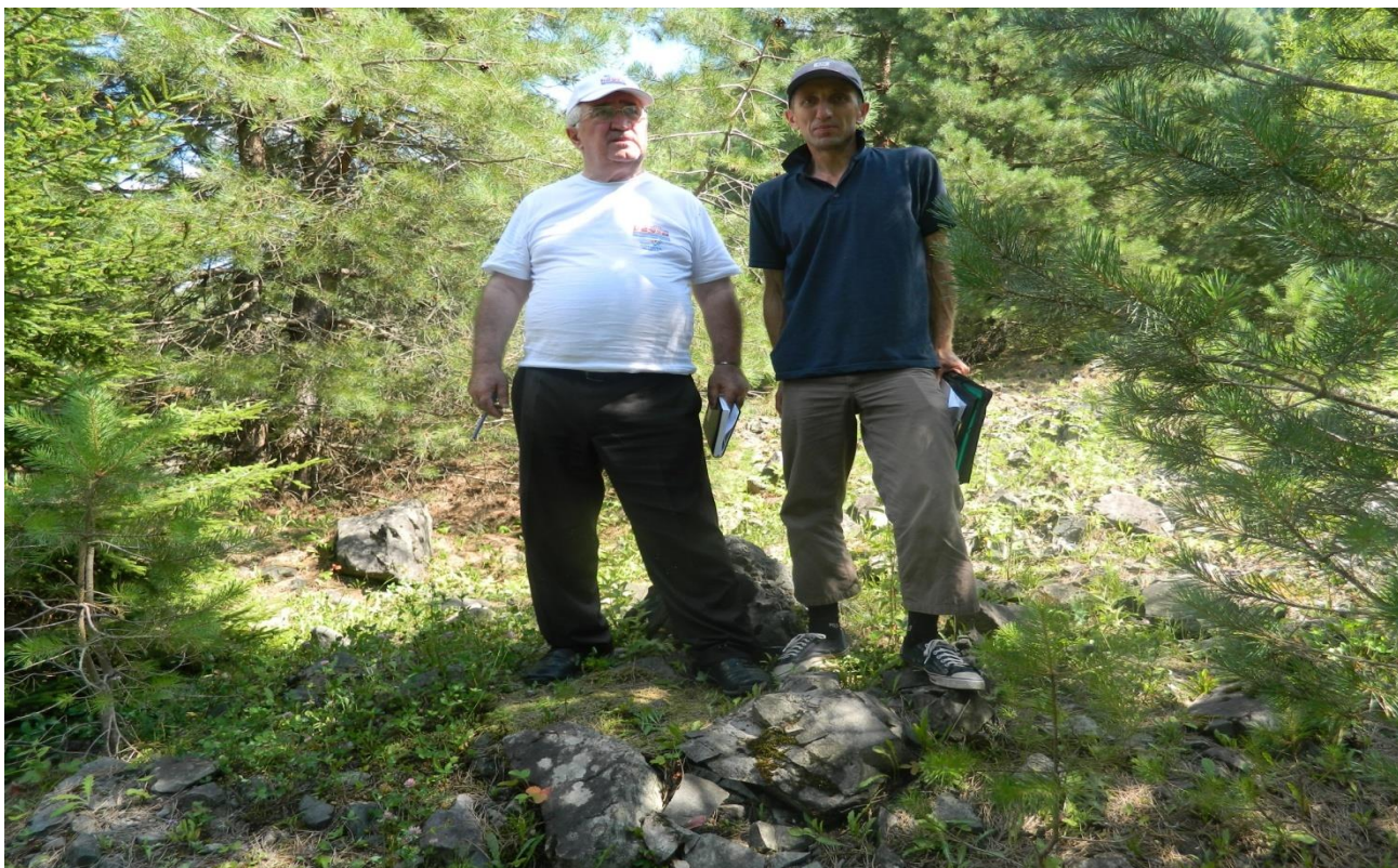
21. წაბლანის ნამეწყრალზე ფიჭვის ბუნებრივი განახლების შესწავლა (2012 წ.)