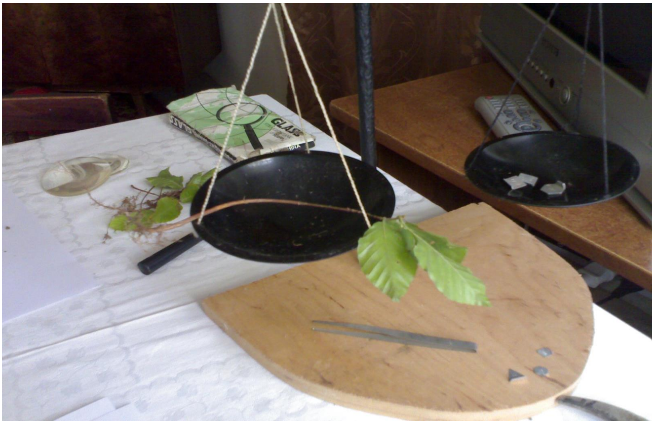
19. აღმოსავლეთის წიფლის 2 წლიანი აღმონაცენის მასის დადგენა (ქედა, 2008 წ)