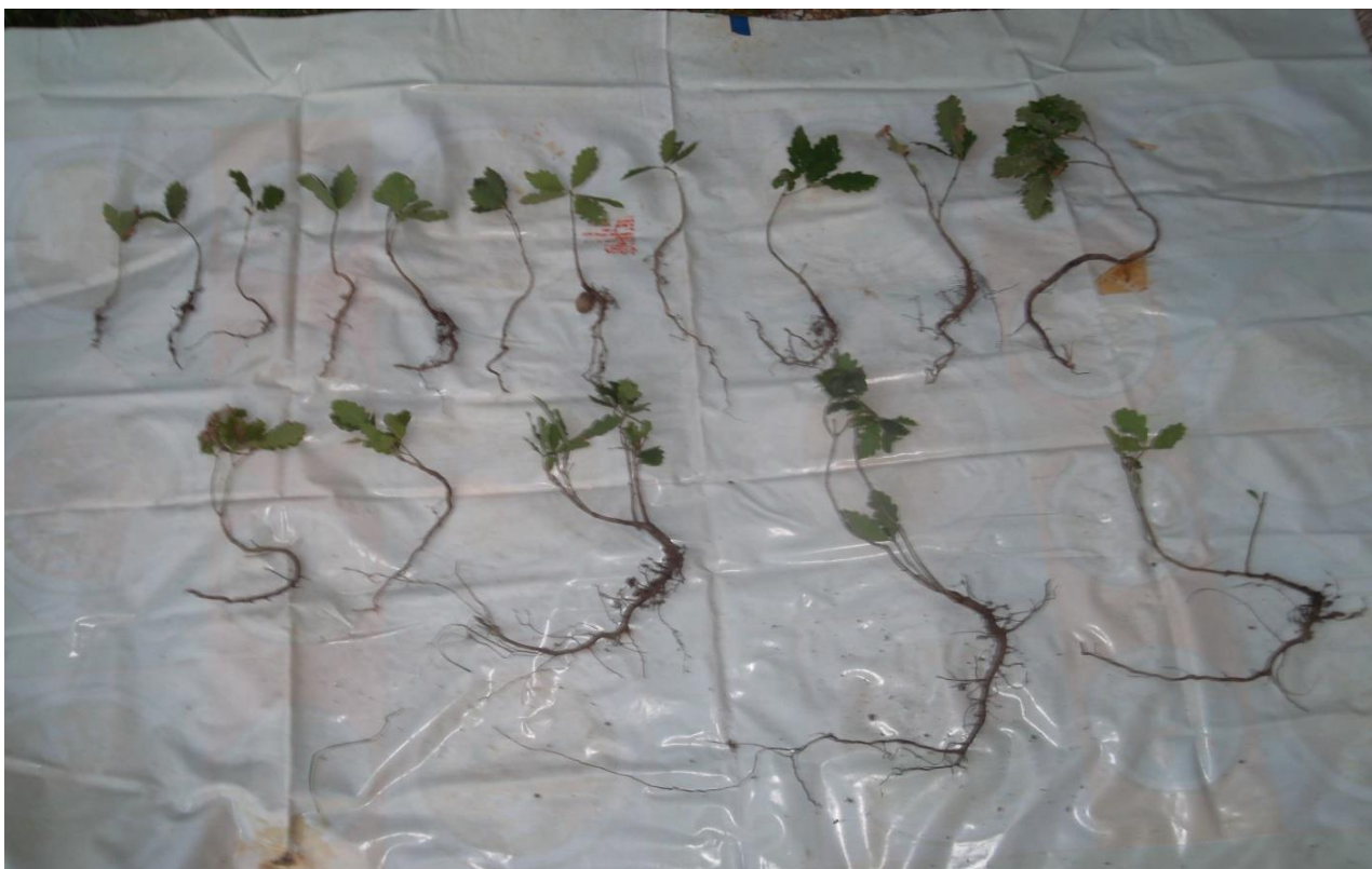
11. მუხის აღმონაცენ-მოზარდი (სოფ. ნიგაზეული, შუახევი, 2011 წ.)