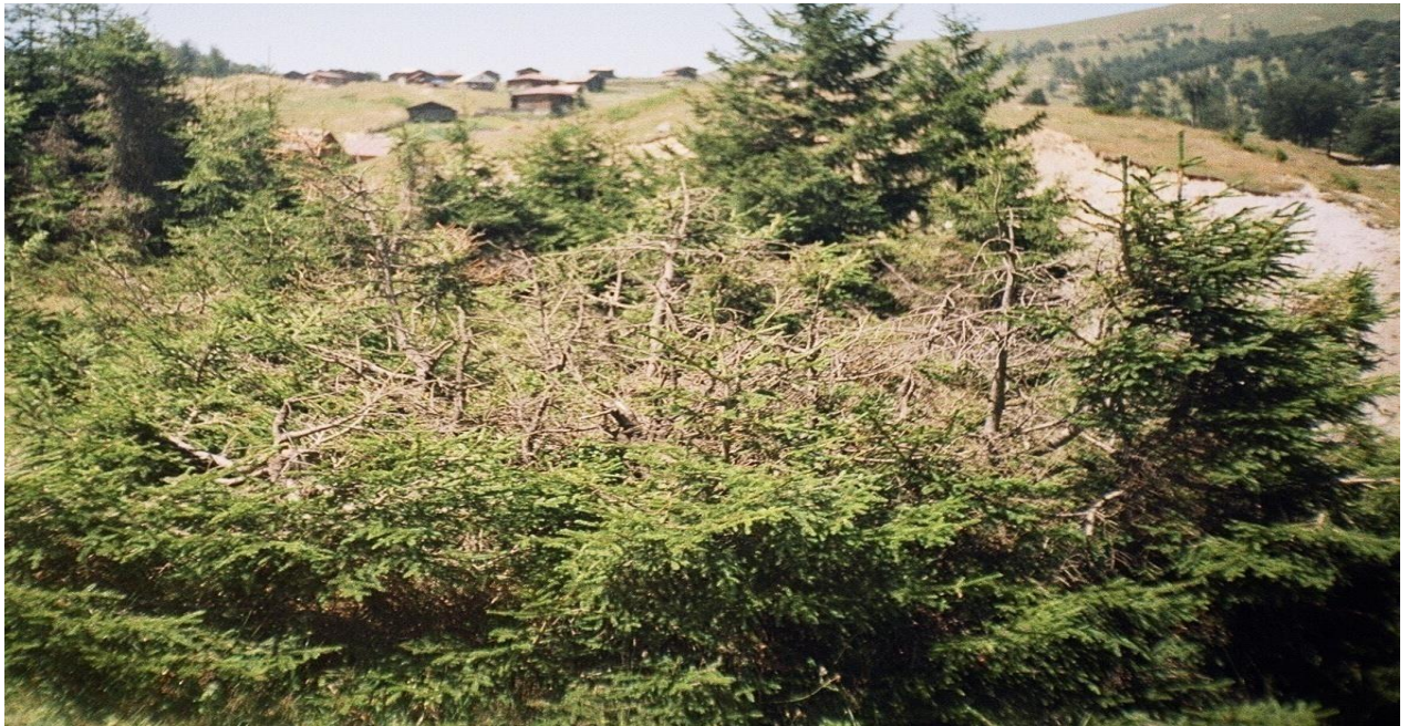
სურ. 3. დაბალი ტემპერატურის და ცივი ქარების ზემოქმედების შედეგად გამხმარი 30 წლიანი აღმოსავლეთის ნაძვის მოზარდი “შქერნალი” (ხულოს რაიონი)

მეტრით. სუბალპური წიფლნარებისა და ნაძვნარ-სოჭნარების ძლიერი გამოსწორვა იწვევს ტყის გარემოსათვის დამახასიათებელი მიკროკლიმატის მკვეთრად ცვლას, აღმონაცენ-მოზარდის მეტად არასახარბიელო მიმართულებით. ტყის საბურველის და ხეთა დგომის სტრუქტურის რღვევა მნიშვნელოვნად აფერხებს სოჭისა და ნაძვის განახლებას, რომლებიც განსაკუთრებით ცუდად ეგუებიან დაბალ ტემპერატურას და ცივი ქარების უარყოფით ზემოქმედებას, რის გამოც 30-40 წლის ასაკშიც კი იწვევენ მათ მასიურ ხმობას (იხ. სურ. 3).