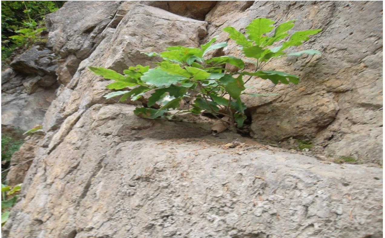
სურ. 18. მთის ქანში ამოსული მუხის მოზარდი (ზამლეო, შუახევი, 2011 წ)

ღებესა და ბზარებში და არა უშუალოდ დედაქანში (იხ. სურ. 18; 19).