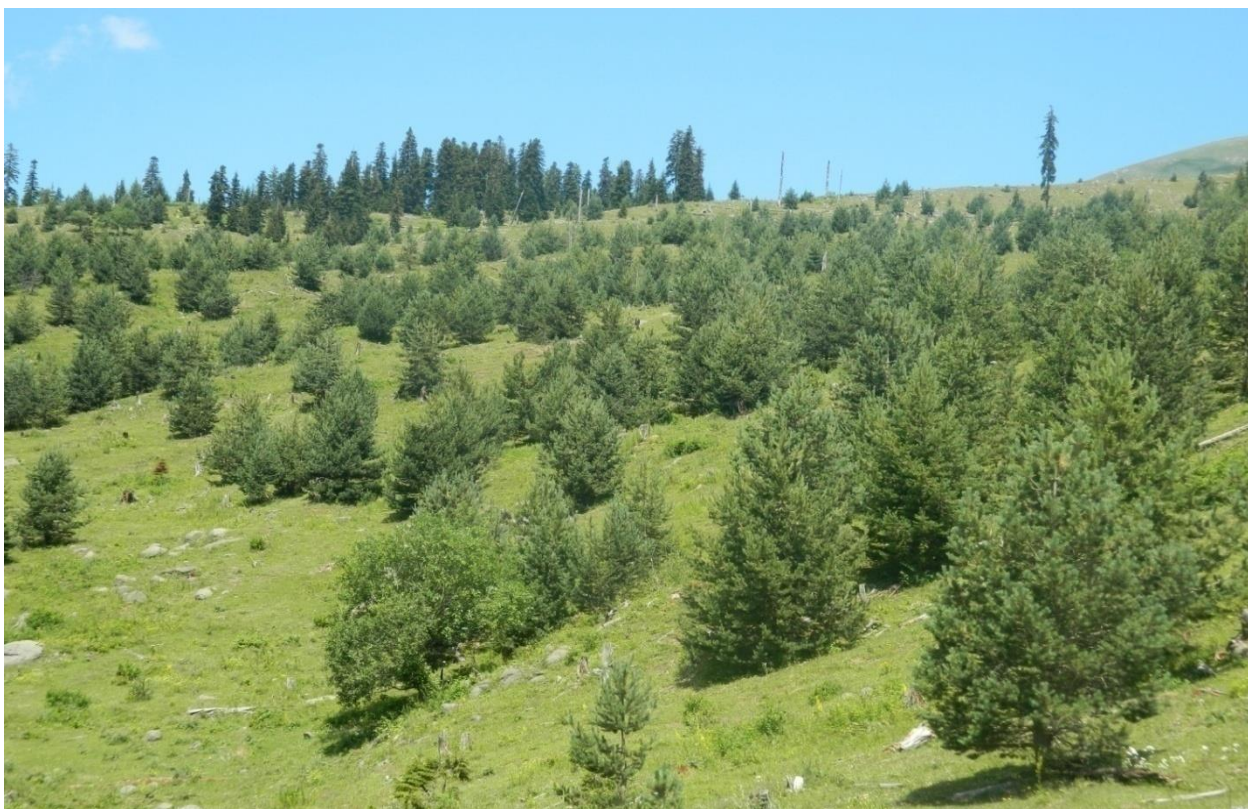
სურ. 8. კავკასიური ფიჭვის ბუნებრივი განახლება ნახანძრალ ფართობზე (შავნაბადა “კუშტური”, 2012 წ)