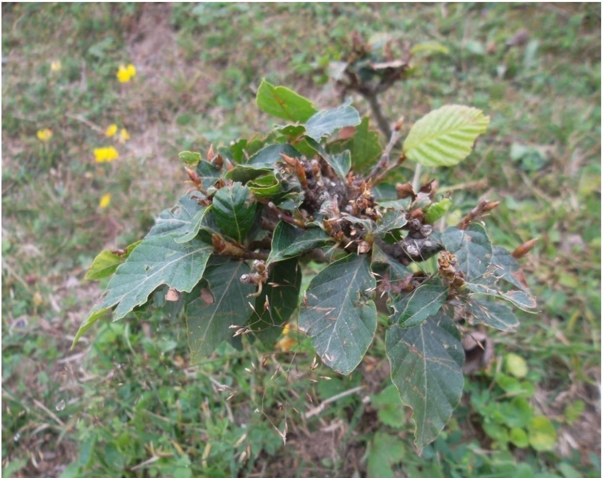
სურ. 17. კენჭერო დაზიანებული აღმოსავლეთის წიფლის მოზარდი (შაენადადა კუშტური, სულო, 2012 წ.)