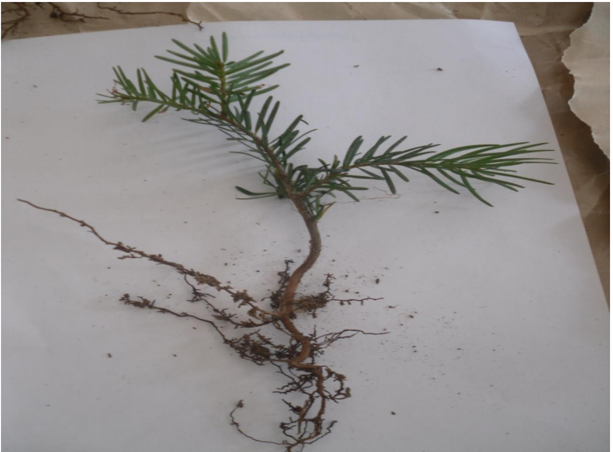
სურ. 21. კავკასიური სოჭის 3 წლიანი აღმონაცენი (ჩირუხი, შუახევი, 2011 წ.)