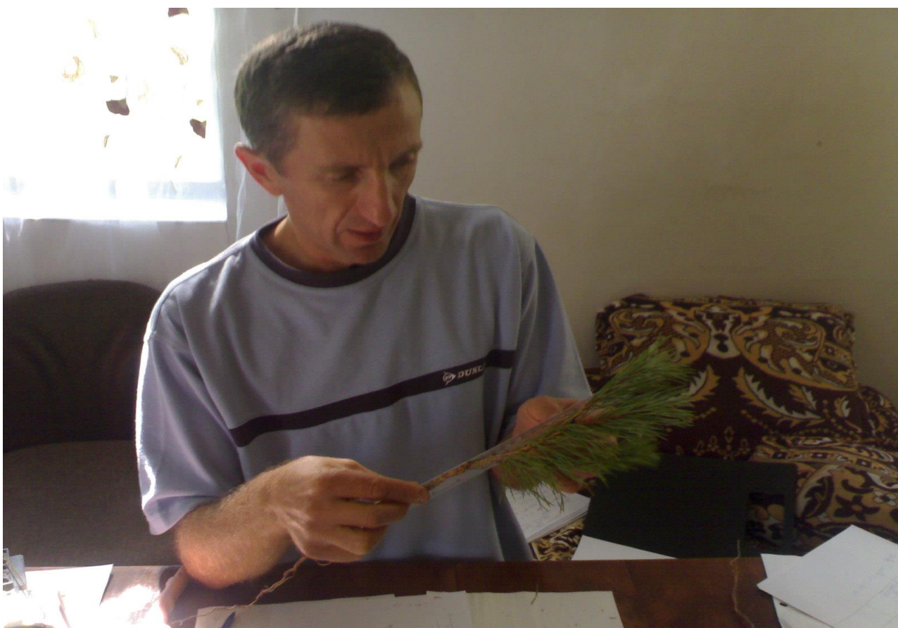
9. ჩვეულებრივი ფიჭვის მიწისზედა და მიწისქვეშა ორგანოების სიგრძის დადგენა (“შაენაბადა”, სოფ. წაბლანა, ხულო, 2012 წ.)