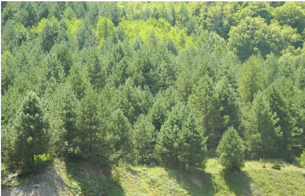
სურ. 7. კავკასიური ფიჭვის ბუნებრივი განახლება ნამეწერალ ფართობზე (ხულო, წაბლანა – 1989 წლის 19 აპრილის ნამეწერალი, 2012 წ)