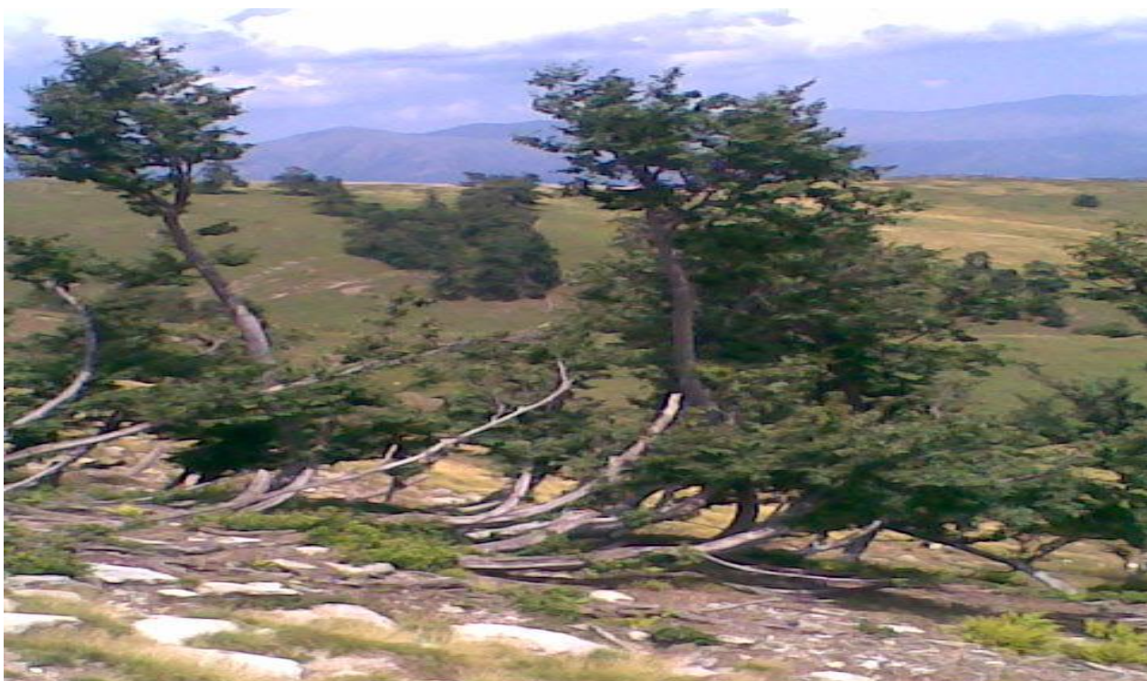
სურ. 5. სუბალპური ტანბრეცილი წიფუნარი, (მთა “ლოდიბირი” ხულო, 2010)