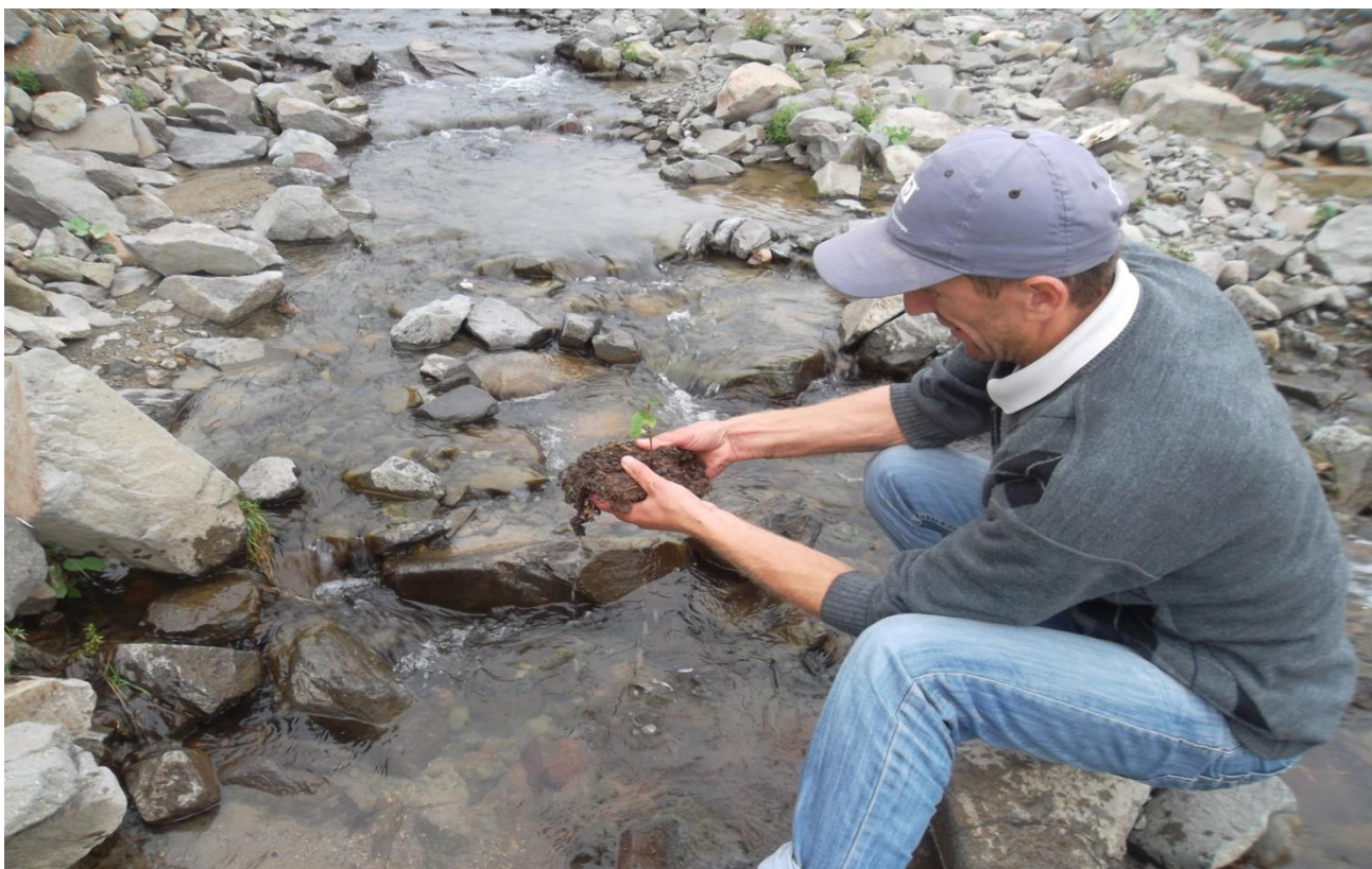
22. აღმოსავლეთის წიფლის 2 წლიანი აღმონაცენის ფესვების განთავისუფლება ნიადაგისაგან (მთა ლოდიბირი, სულო 2011)