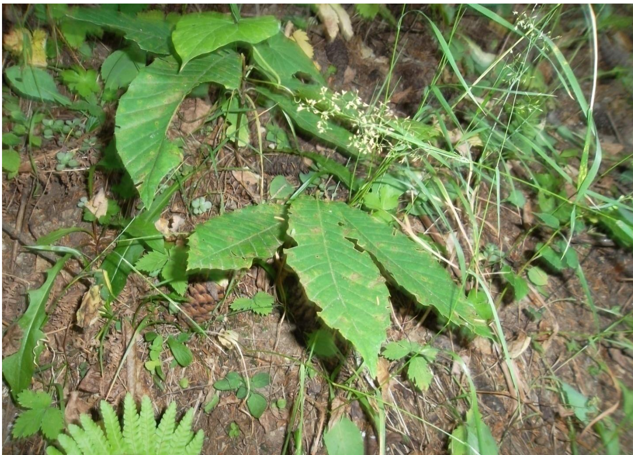
სურ. 12. ჩეულებრივი წაბლის ორწლიანი აღმონაცენი, (ქედა, 2010 წ)