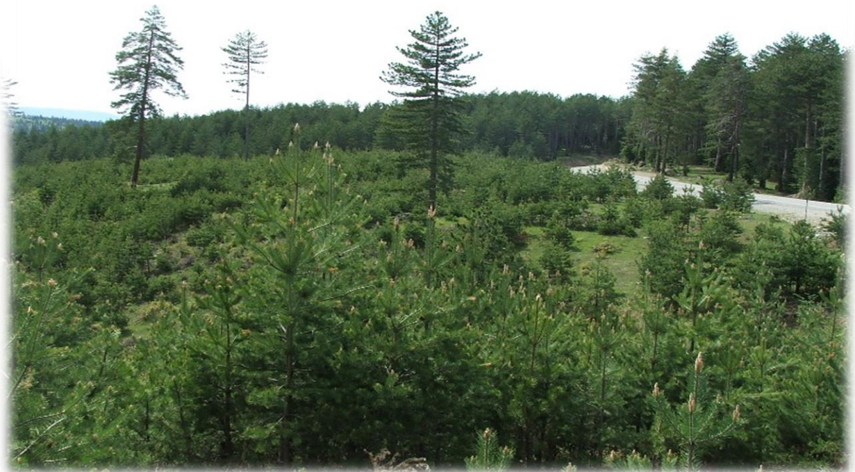
სურ. 9. კავკასიური ფიჭვის ბუნებრივი განახლება პირწმინდა ტყეკაფზე ("ყარაგოლი" – შავშეთი, 2011 წ)

ცნობილია, რომ ტყის ხანძრებს დიდი ზიანი მიაქვთ, როგორც სატყეო მეურნეობისათვის, ისე ქვეყნის ეკონომიკისათვის. ხანძარი ტყესთან ერთად ანადგურებს ქვეტყეს, მოზარდს, ცოცხალ და მკვდარ საფარს, აუარესებს ტყის ნიადაგდაცვით, წყალმარეგულირებელ სანიტარულ-ჰიგიენურ თვისებებს, ისპობა ნადირ-ფრინველთა თავშესაფარი. ნახანძრალი ფართობების აღდგენა კი დაკავშირებულია დიდ შრომატევად სამუშაოებთან, რომელიც დიდ ფინანსურ დანახარჯებს მოითხოვს. ამიტომ ხანძრის გაჩენის შემთხვევები მინიმუმამდე უნდა იქნეს დაყვანილი, მითუმეტეს, რომ უმეტეს შემთხვევაში ხანძრის მიზეზი ადამიანის გაუფრთხილებელი და დაუდევარი საქციელის შედეგია.