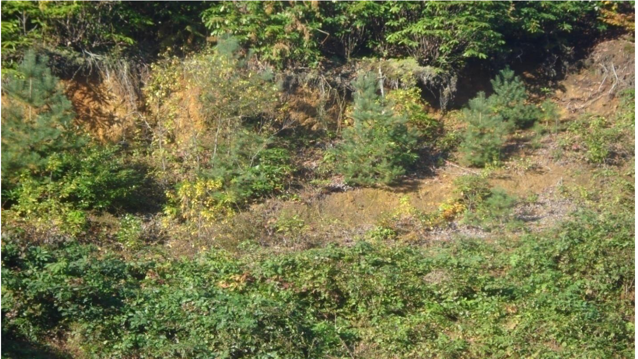
1. ჩვეულებრივი ფიჭვის ბუნებრივი განახლება, (ქ. არჰაგი, თურქეთი, 2011 წ.)