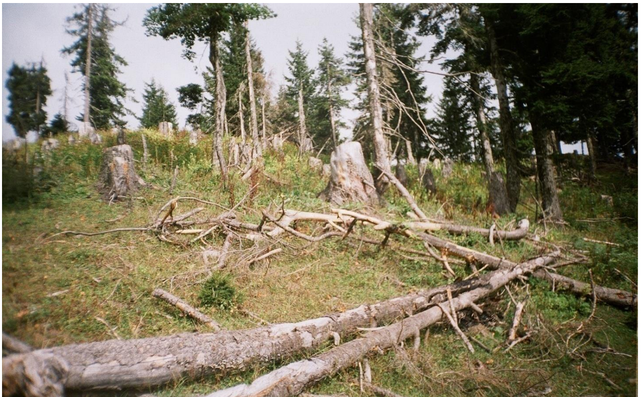
სურ. 15. ადამიანის მიერ განადგურებული ნაძვნარ-სოჭნარი ტყე ("სამსმელო" ხულო, 2008 წ)