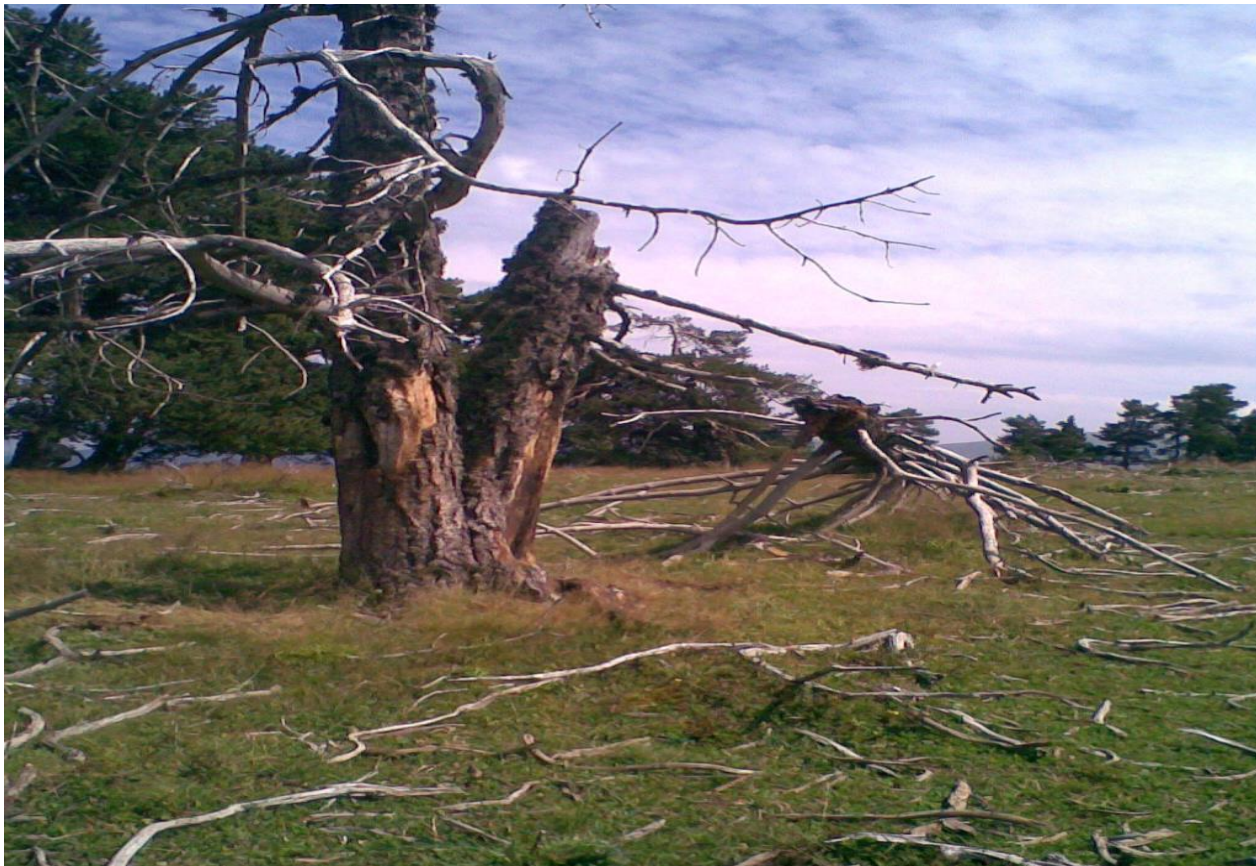
სურ. 6. სუბალპური ფიჭვნარი (“ზინენგები”, ხულო, 2010 წ)