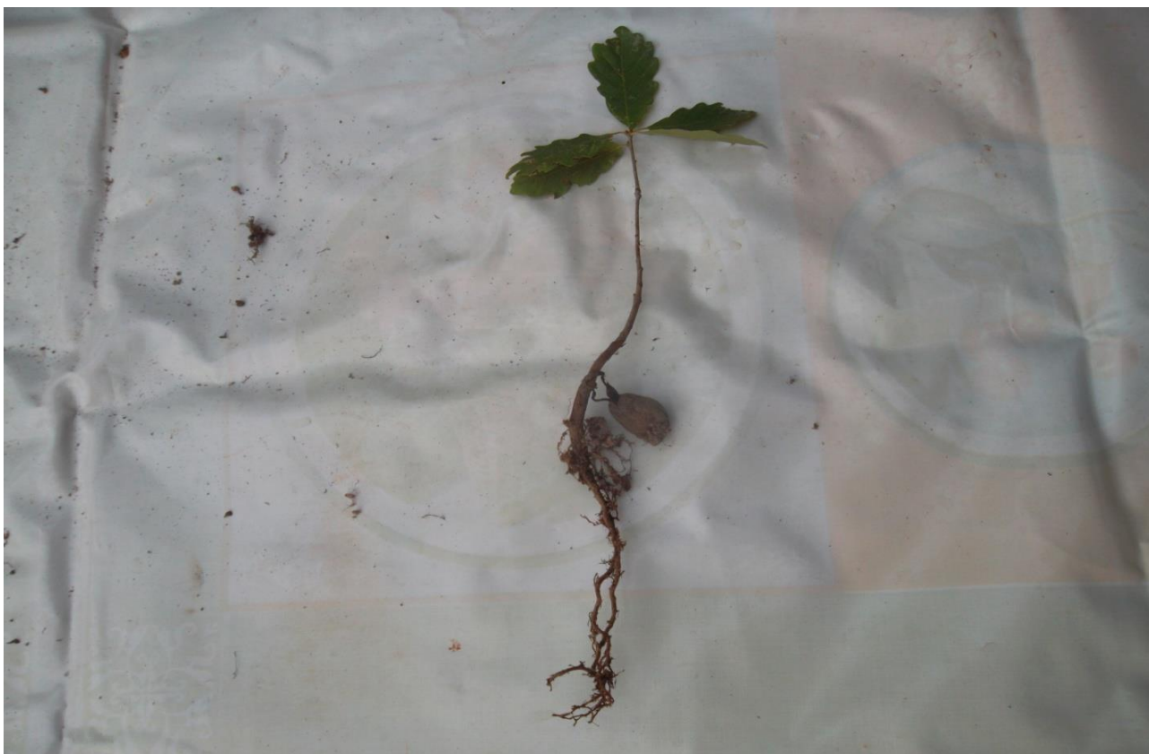
10. მუხის 3 წლიანი აღმონაცენი (სოფ. პაქსაძეები, ხულო, 2011 წ.)