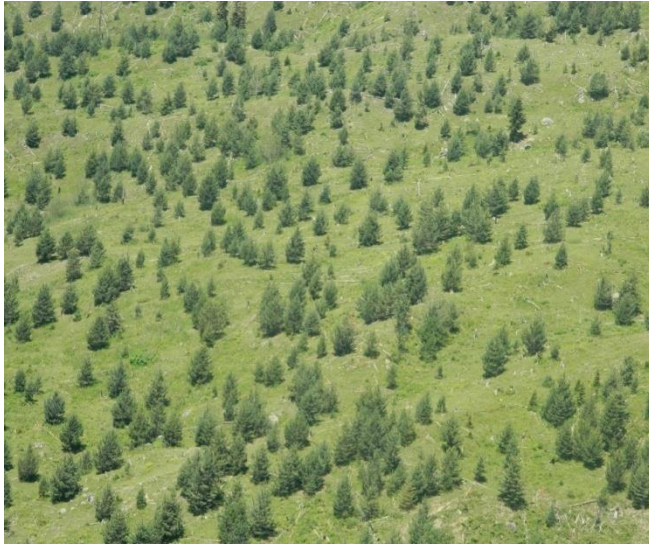
3. ჩვეულებრივი ფიჭვის ბუნებრივი განახლება, (“კუშტური”, შაგნაბადა, ხულო, 2012 წ.)