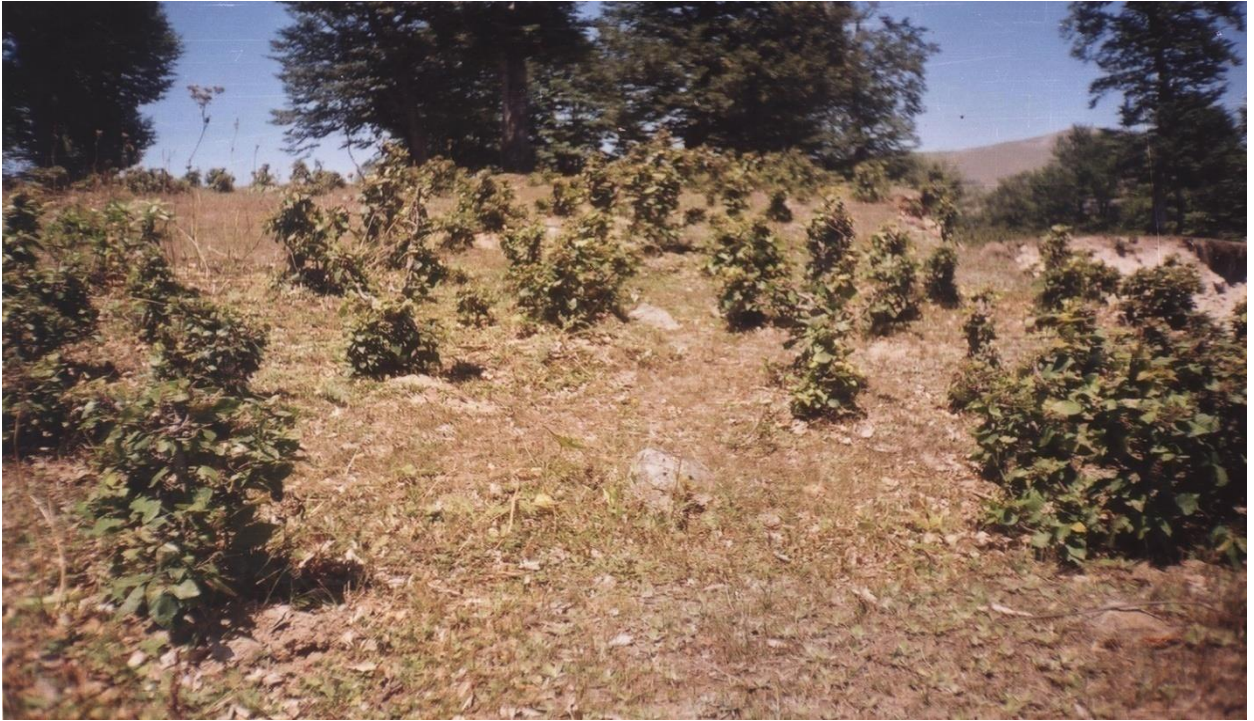
სურ. 16. საქონლის მიერ მექანიკურად დაზიანებული აღმოსავლეთის წიფლის მოზარდი (შქერნალი, სულო, 2008 წ.)