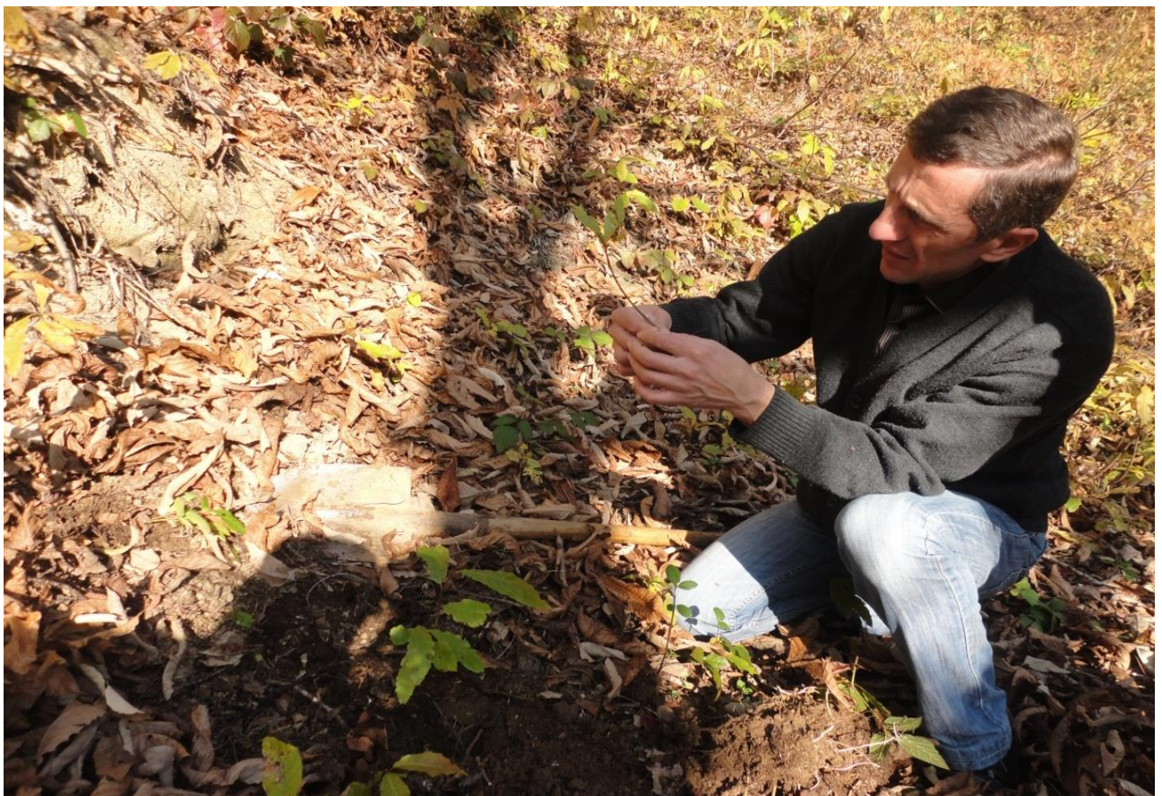
15. ჩვეულებრივი წაბლის 3 წლიანი აღმონაცენი, (კინტრიშის ნაკრძალი, 2012 წ)