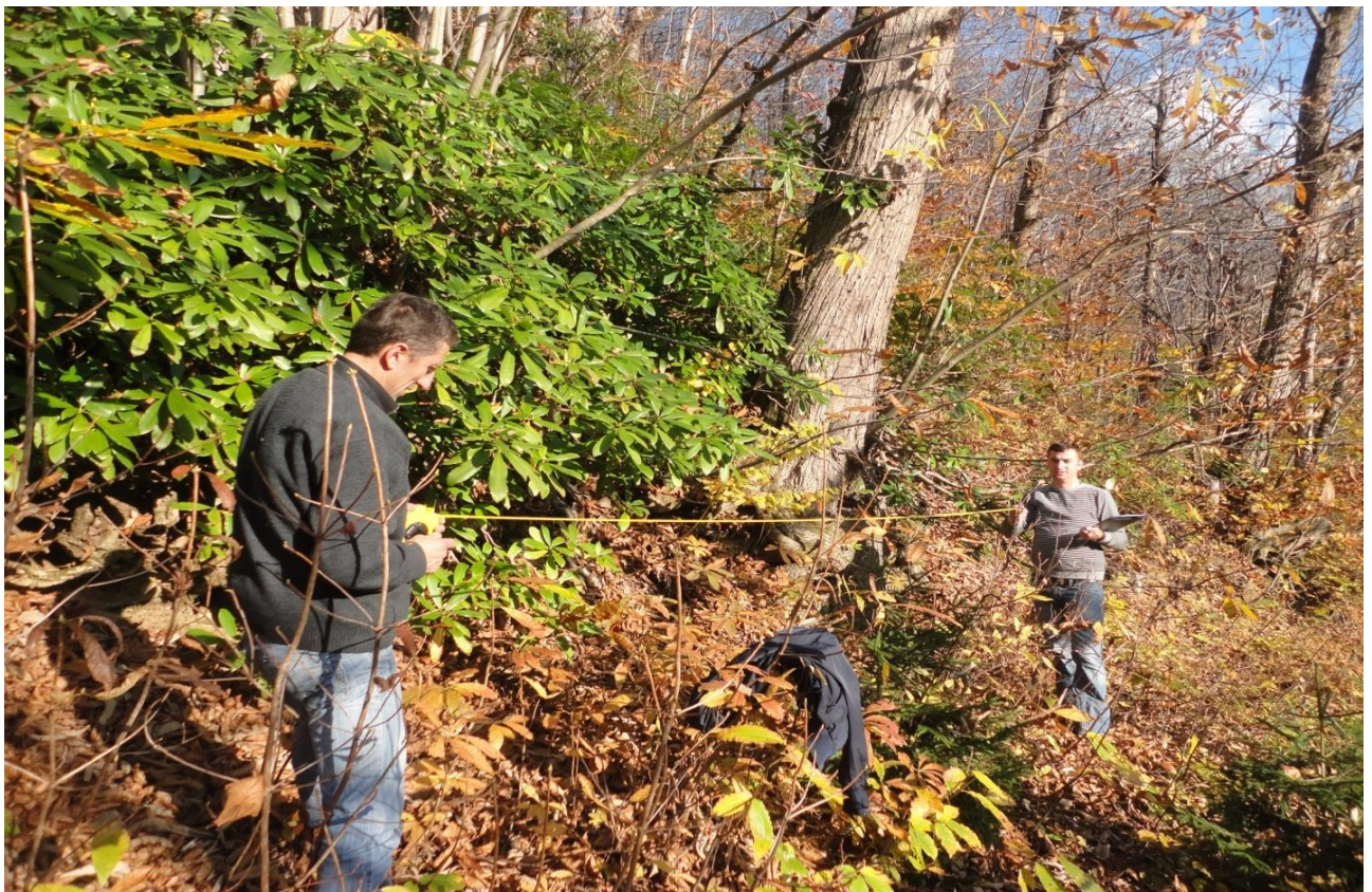
14. სანიმუშო ფართობის აღება ტყის ტიპში “წაბლნარი შქერის ქვეტყით”, (კინტრიშის ნაკრძალი, 2012 წ)