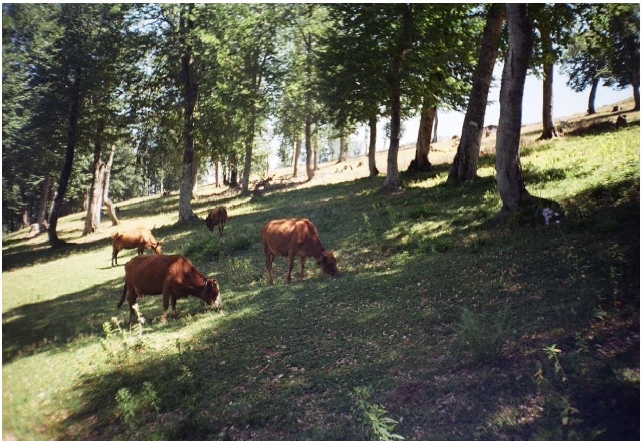
სურ. 11. საქონლის ძოვების გაგლეხით შეწყვეტილი ბუნებრივი განახლება ("ყორანა" - გოდერძის უღელტეხილი, 2009 წ)