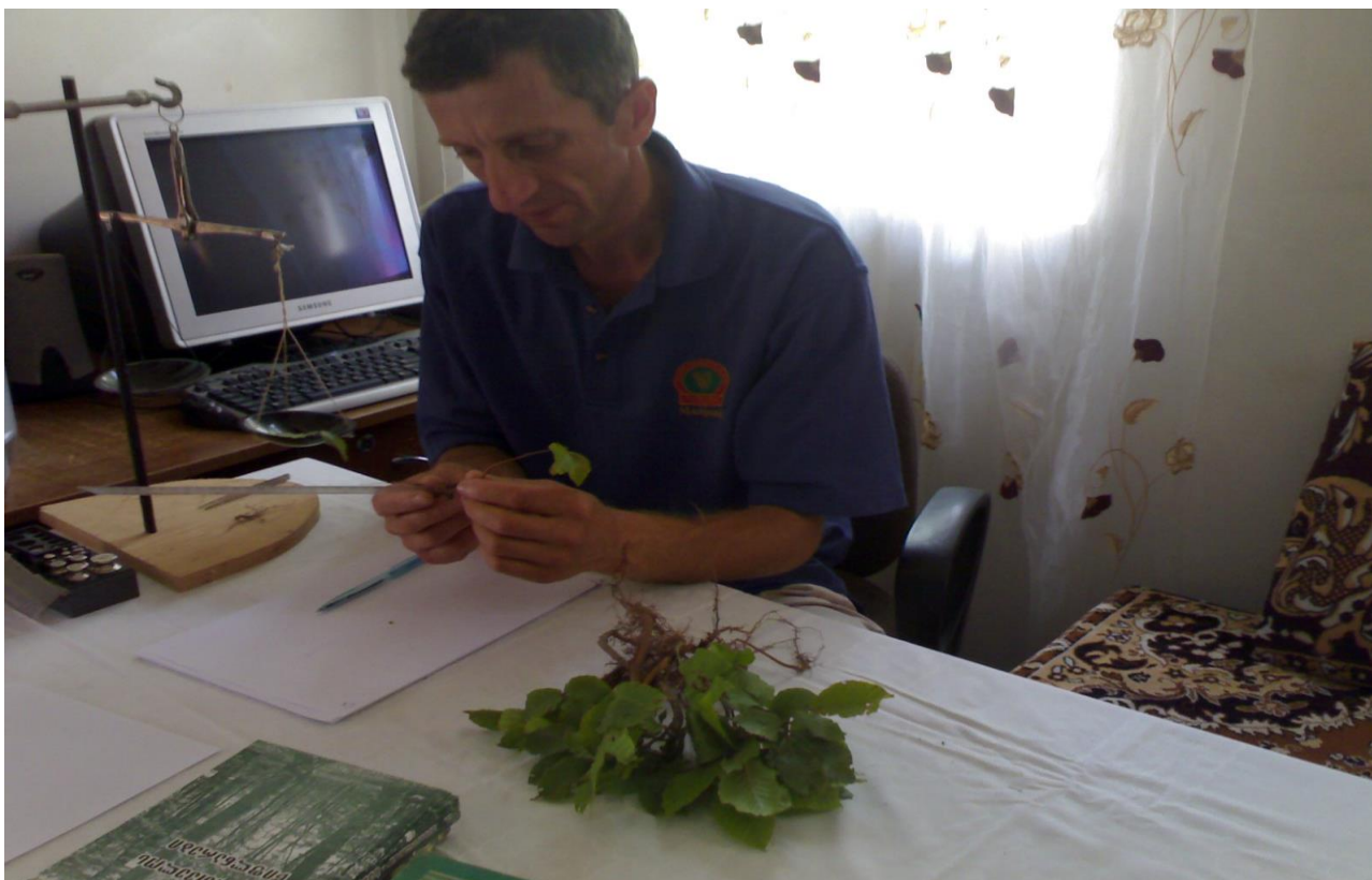
6. აღმოსავლეთის წიფლის მოზარდის სიგრძის და მასის დადგენა (გოდერძის უფელტეხილი, 2010 წ)