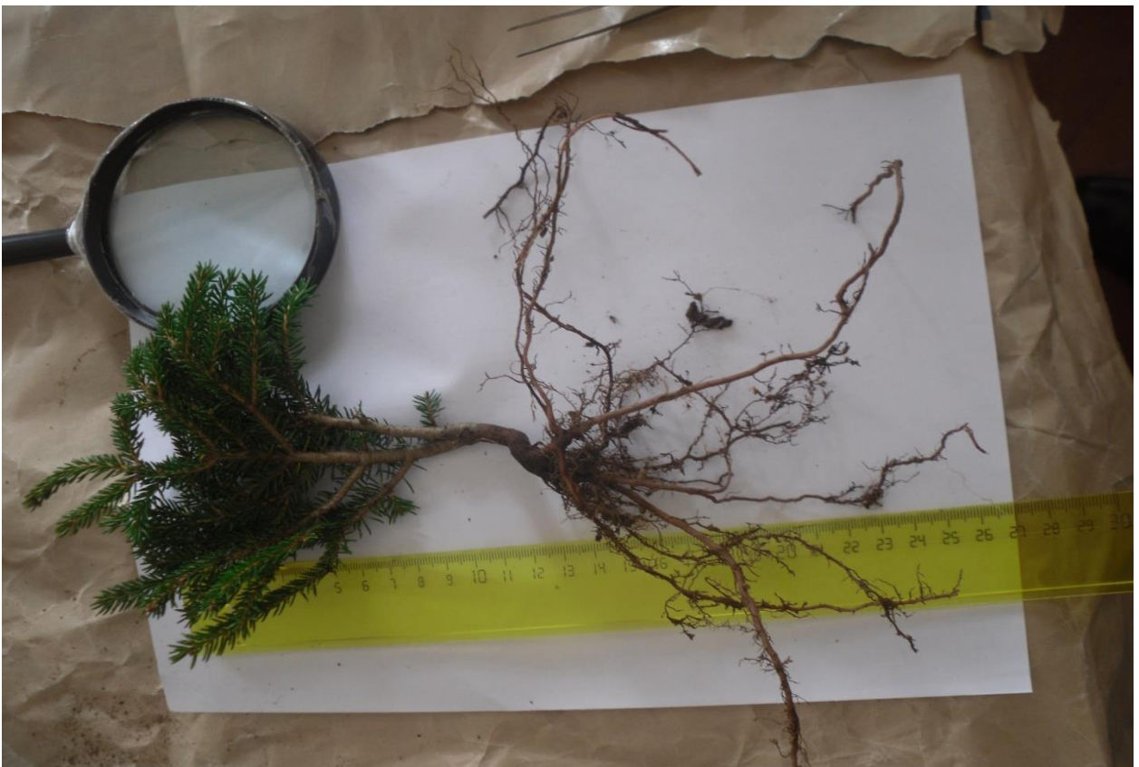
2. აღმოსავლეთის ნაძვის მოზარდის ხნოვანების და სიგრძის დადგენა ("სამსმელო", ხულო, 2011 წ.)