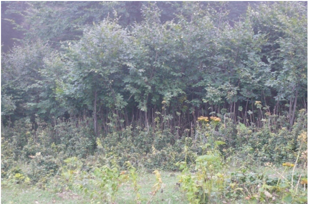
სურ. 10. აღმოსავლეთის წიფლის ბუნებრივი განახლება საქონლის ძოვებისაგან დაცულ უბანში ("შქერნალი" – ხულო, 2011 წ)