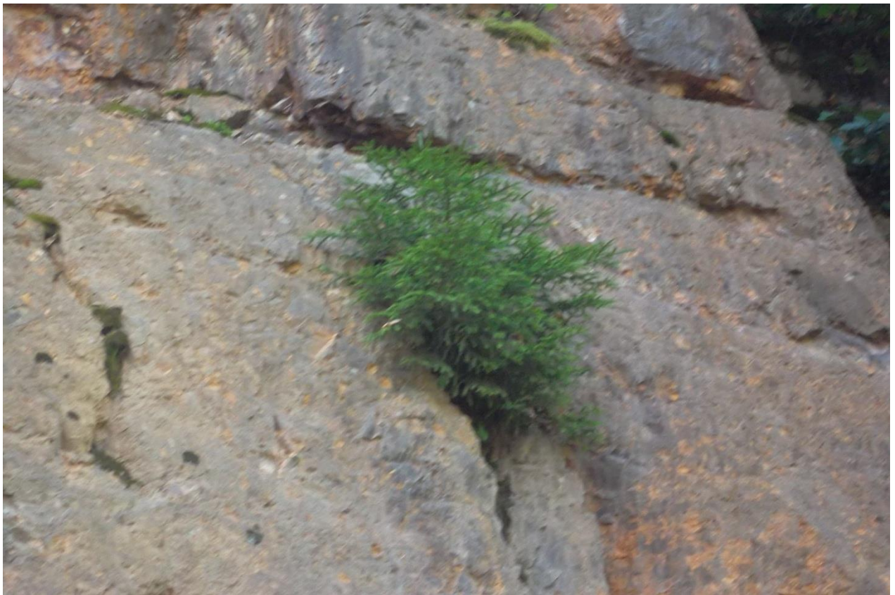
სურ. 19. მთის ქანში ამოსული აღმოსავლეთის ნაძვის მოზარდი (დიოკნისი, ხულო, 2010 წ)