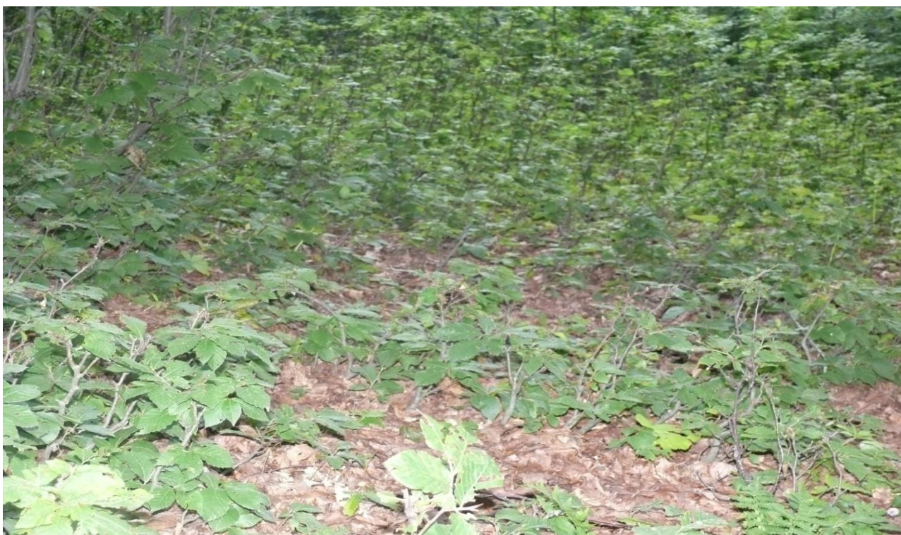
7. აღმოსავლეთი წიფლის ბუნებრივი განახლება საქონლის ძოვებისაგან დაცულ უბანში (“შქერნალი”, ხულო) 2008 წ