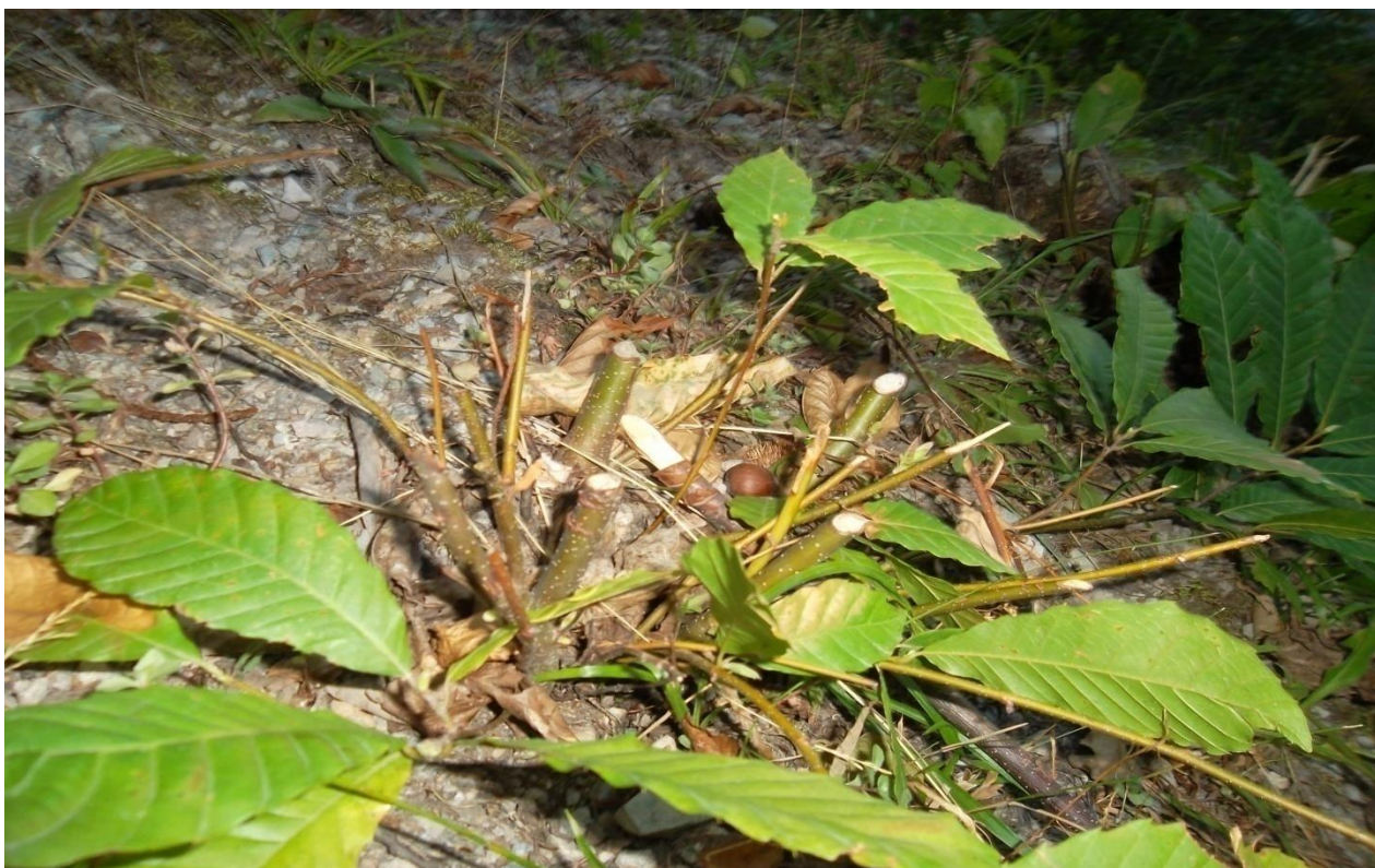
სურ. 13. თიბვის დროს დაზიანებული ჩეულებრივი წაბლის ხუთწლიანი მოზარდი, სულა 2012 წ)