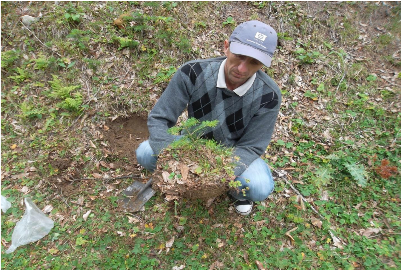
12. კავკასიური სოჭის 3 წლიანი აღმონაცენი (მთა “ლოდიბირი”, 2011 წ.)