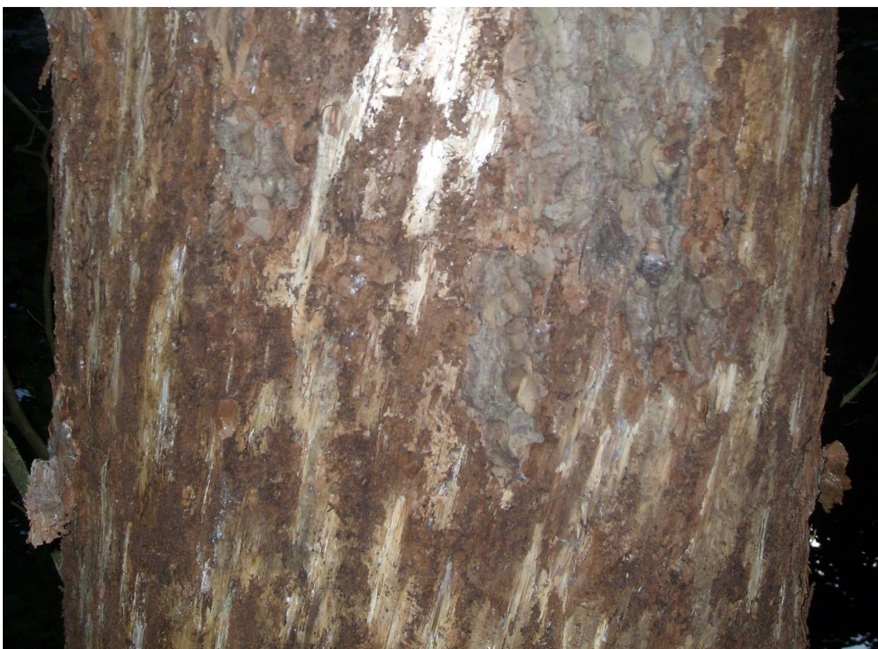
სურ. 2. ქერქშემოცლილი ანუ “დაყვერილი” აღმოსავლეთის ნაძვი, (ლეღვანი, შუახევი, 2007 წ)