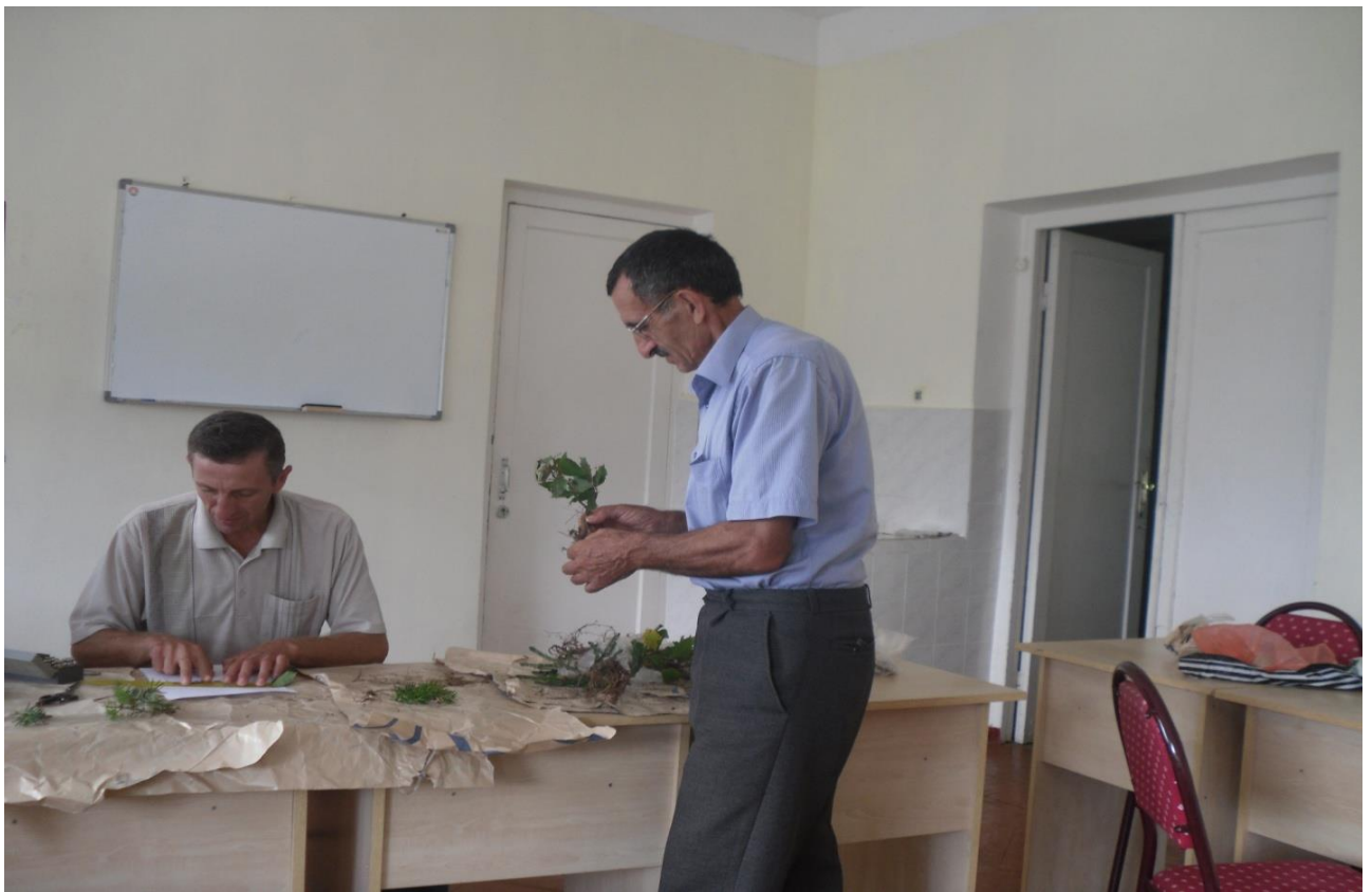
18. აღმოსავლეთის წიფლის მიწისზედა და მიწისქვეშა ორგანოების სივრძის და მასის დადგენა (მწვანე კონცხი, 2011 წ.)