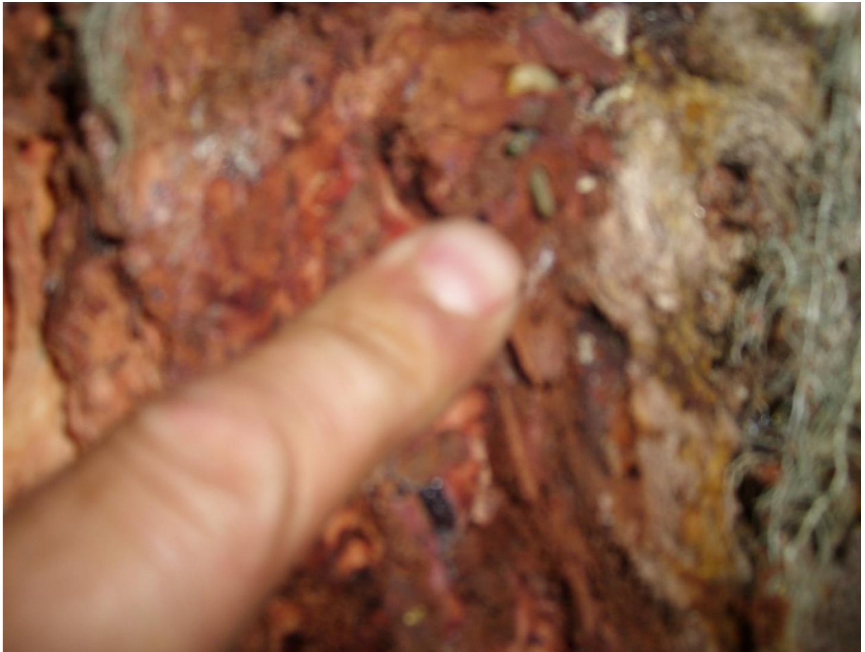
სურ. 14. ექვსკბილა ქერქიჭამიასაგან დაზიანებული აღმოსავლეთის ნაძვი ("ჩირუხი" შუახევი, 2010 წ)