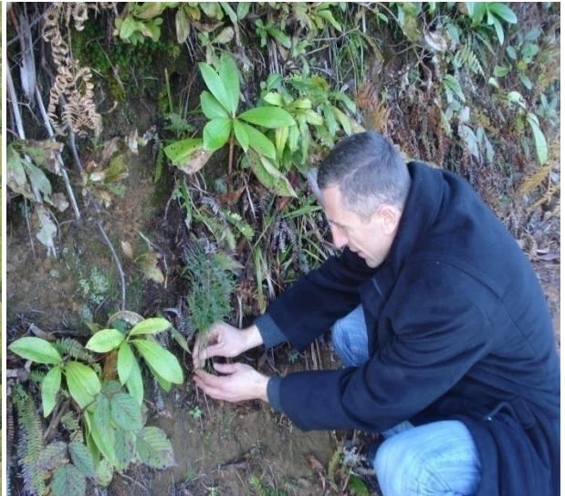
4. 3 წლიანი ჩვეულებრივი ფიჭვის აღმონაცენი ტყის ტიპში: “ფიჭვნარი მარადმწვანე ქვეტყით”. (ქ. ართვინი, თურქეთი, 2011 წ.).