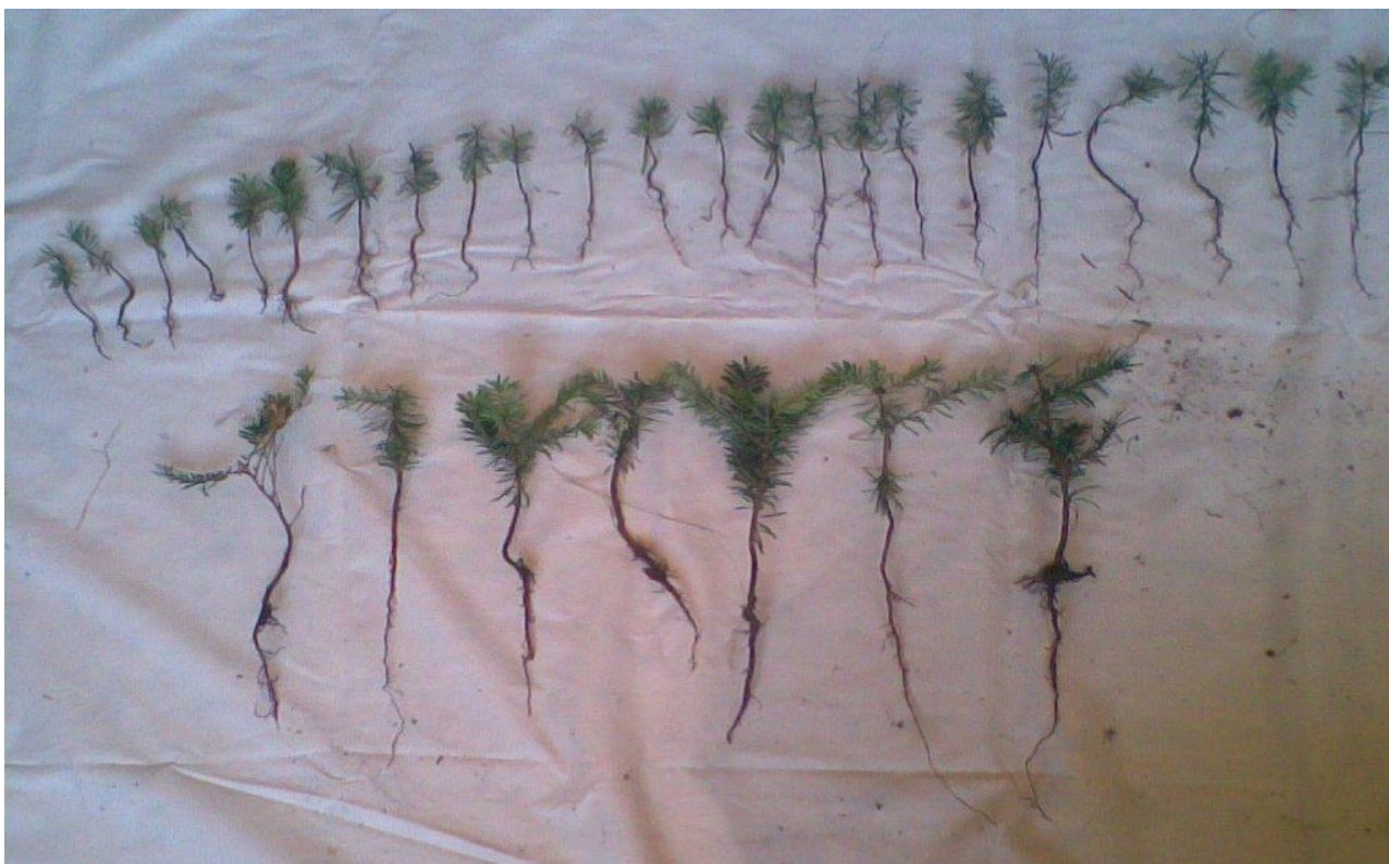
8. კავკასიური სოჭის აღმონაცენ-მოზარდი (“ჩირუხი”, შუახევი, “ყარაგოლი” თურქეთი 2011 წ.)