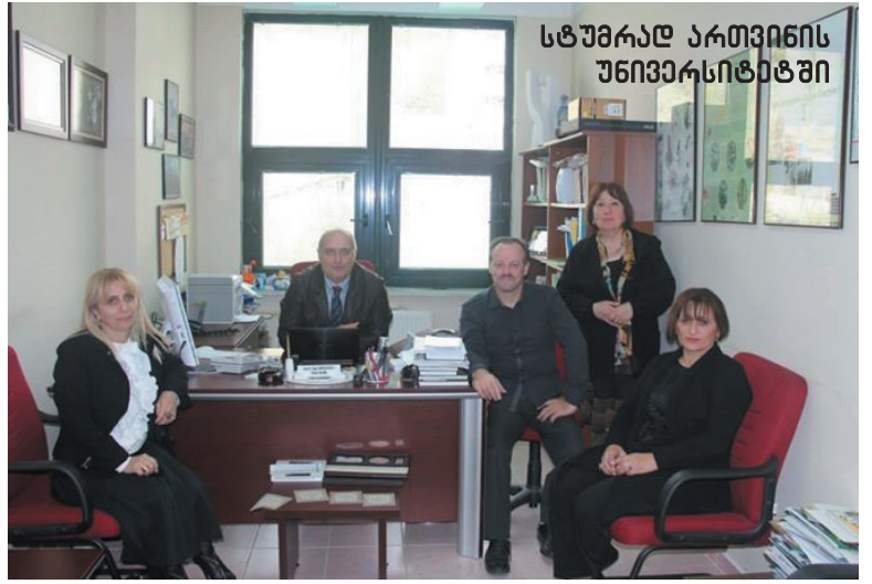
სტუმრად ართვინის უნივერსიტეტში

გარდა ზემოთ აღნიშნული მიზნების განხორციელებისა, საზაფხულო სკოლა მეტად შთამბეჭდავი აღმოჩნდა ორივე უნივერსიტეტის სტუდენტთათვის. ეკოლოგიური ცნობიერების ამაღლებისა და საველე მუშაობის პრაქტიკული უნარ-ჩვევების ჩამოყალიბების გარდა, სკოლამ განაპირობა ორი ქვეყნის ახალგაზრდობის კულტურული, ეთ-