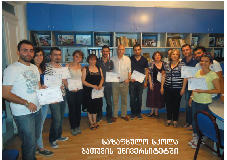
საზაფხულო სკოლა ბათუმის უნივერსიტეტში