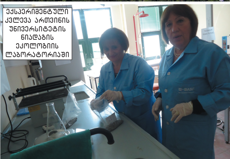
ექსპერიმენტული კვლევა ართვინის უნივერსიტეტის ნიდაზის ეკოლოგიის ლაბორატორიაში

რედაქტორი: იოსებ სანიკიძე საუბიუროსი: ნესტან მავუჭაძე