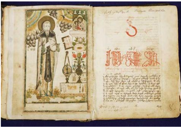
სურ. 1. სიტყვის კონა, 1730 წ.

სულხან-საბა ორბელიანს დიდი დამსახურება მიუძღვის ქართული კულტურის, საერო და სასულიერო მწერლობის, ლექსიკოგრაფიის, მეცნიერების აღორძინებისა და განვითარების საქმეში. საბას “სიტყვის კონა”, ქართული ენის განმარტებითი ლექსიკონი, განსაკუთრებული მოვლენაა ქართული კულტურის, ენისა თუ მეცნიერების ისტორიის თვალსაზრისით.