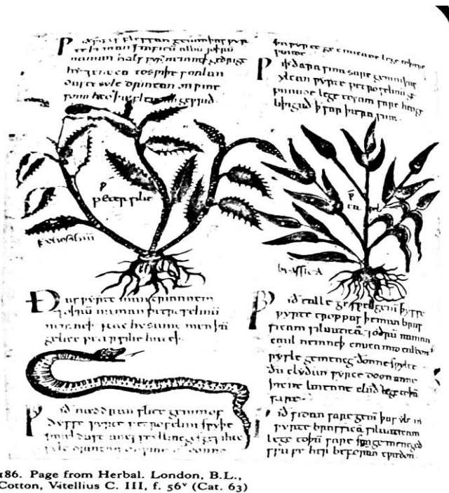
186. Page from Herbal. London, B.L., Cotton, Vitellius C. III, f. 56r (Cat. 63)

ყოველივე ზემოთქმული მეტყველებს ძირითადად სასულიერო და საერო ლიტერატურის განვითარებაზე, თუმცა, ეს როდი ნიშნავს იმას, რომ არ ხდებოდა მეცნიერული შრომების თარგმნა. ბიბლიისა და მხატვრული ლიტერატურის პარალელურად ითარგმნებოდა ტრაქტატები მედიცინის და სხვა სამეცნიერო სფეროებიდან. ელზბეტა ტემპელი თავის ანგლო-საქსონურ მანუსკრიპტების კრებულში მოიხსენიებს აპელიუსის სახელთან დაკავშირებული ჰერბარიუმისა (Herbarium) და სექსტუს პლაციტიუსის “Medicine de quadripedibus“-ის ანგლო-საქსონურ თარგმანებს, რემლებიც მე11 საუკუნით თარიღდება (Temple 1976 :81).