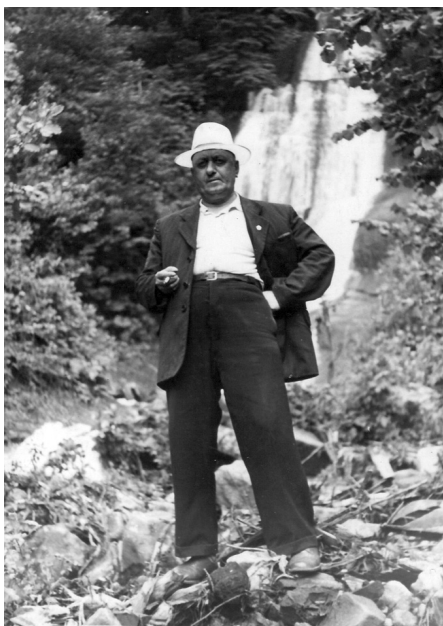
მუმს უსათუოდ მივიტან...

გობრუნებთ დიდის მადლობით თქვენს ხელნაწერს: „გვაროვნული წყობის გადმონაშთები ზემო აჭარაში“. თქვენი დახმარება კიდევ დამჭირდება უთუოდ, რომ პიესა ისეთი გამოვიდეს, თქვენ რომ მისურვით, მხოლოდ თქვენ... ბევრს „თხოვლობით“... და ძნელ მოვალებობას მაკისრებთ. ერთი კია: პიესა დაწერილი იქნება სიყვარულით და ჩემს მაქსიმალურად დახმარებით.