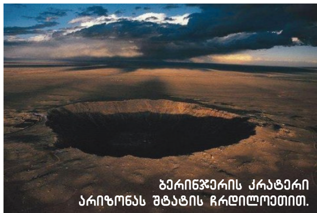
ბერიჯიარის კრატერი არიზონას შტატის ჩრდილოეთით.

დედამინა თავისი ორბიტის მიმართ დახრილია 23.5°-ით. მზის გარშემო მოძრაობისას იგი მუდამ ინარჩუნებს თავის მიმართულებას და პოლუსის ვარსკვლავისაკენ იყურება. ამის გამო დეკემბერ-ში მინის სამხრული პოლუსი მზისკენაა, მარტში კი-მინის მარცხენა მხარე. ასევე ივნისში ჩრდილო პოლუსია მზისკენ და სექტემბერში მინის მარჯვე-