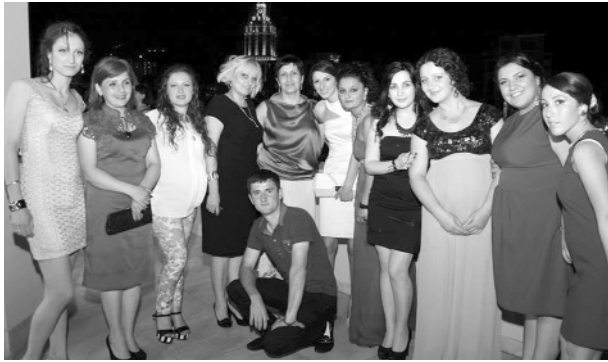
ქართული ფილოლოგიის დეპარტამენტი

ეს დაუვიწყარი საღამო დიხანს დაამახსოვრებდათ როგორც კურსდამთავრებულებს, ასევე ლექტორ-მასწავლებლებსაც. ამით 2013 წლის ქართული ფილოლოგიის კურსდამთავრებულმა კარგ ტრადიციასაც ჩაუყარეს საფუძველი.