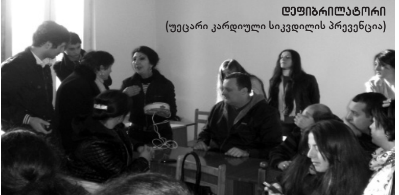
დეფიბრილატორი (უეცარი კარდიული სიკვდილის პრევენცია)