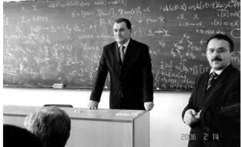
პროფ. ვ. ბალაძე მოხსენებით გამოდის საერთაშორისო სიმპოზიუმზე — ტოპოლოგია და მისი გამოყენებანი.

ნებისმიერი კატეგორიის პირდაპირი სისტემების კატეგორიის ფაქტორ-კატეგორია; დაამტკიცა კატეგორიის ობიექტის კოგავართობის არსებობის თეორემა; მოქმენა ის აუცილებელი და საკმარისი პირობები, რომელთა შემთხვევაში მოცემული კატეგორიისა და მისი ქვეკატეგორიის წყვილისთვის არსებობს კომპაქტური კატეგორია, ე.წ. აბსტრაქტული კომპაქტური კატეგორია; დაადგინა ამ კატეგორიის მორფიზმების ეპიმორფულობის, მონომორფულობის