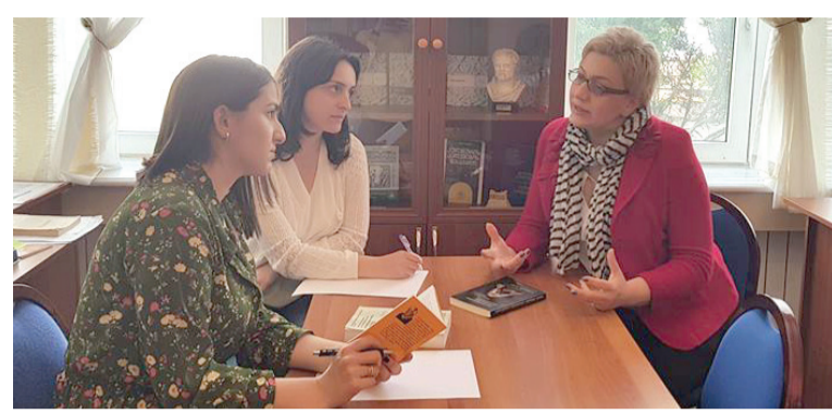
ა.შ. აღსანიშნავია, რომ ფილოსოფიის სწავლების გარეშე საუნივერსიტეტო ცოდნა ნაკლოვანია, რადგან ის ვინროდისციპლინარია და მოკლებულია სისტემურ და უნივერსალურ ხასიათს. ფილოსოფია კი ცდილობს, ადამიანები დააფიქროს იმგვარი კითხვების შესახებ, რომლებიც სცდება ვინროდისციპლინურ სფეროს და ინტერდისციპლინური ცოდნის მეთოდოლოგიური საფუძველია.

— უნივერსიტეტების არსებობის ისტორიამ ნათლად აჩვენა, რომ ადამიანის განვითარების ყველა ეტაპზე დიდი მნიშვნელობა ენიჭება უნივერსიტეტის ცოდნის დაგროვებას, რაც გამოიხატება სხვადასხვა დისციპლინათა შორის თანამშრომლობის შედეგად მიღებული ცოდნის სტატუსში. თანამედროვე სამეცნიერო სისტემის ერთ-ერთი მთავარი გამოწვევა არის ინტერდისციპლინარული ცოდნის მოთხოვნა. ფილოსოფია, თავისი არსისა და დანიშნულების მიხედვით, ამ ტიპის ცოდნის უზრუნველყოფია. უფრო მეტიც, ფილოსოფია გვთავაზობს ყველა მეცნიერებათა შესავალ მეთოდოლოგიას, ის არის ერთგვარი პრობლემეტიკა მეცნიერებისა. სწორედ ამის გამოა, რომ თითქმის ყველა ცალკეულ დარგს და დისციპლინას საკუთარი ფილოსოფია აქვს, მაგალითად, სამართლის ფილოსოფია, პოლიტიკის ფილოსოფია, ისტორიის ფილოსოფია, ენის ფილოსოფია და